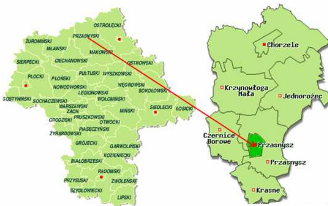
Rysunek 1. Położenie Miasta na tle województwa i powiatu

Miasto Przasnysz położone jest w północnej części województwa mazowieckiego. Zajmuje powierzchnię 2 516 ha.