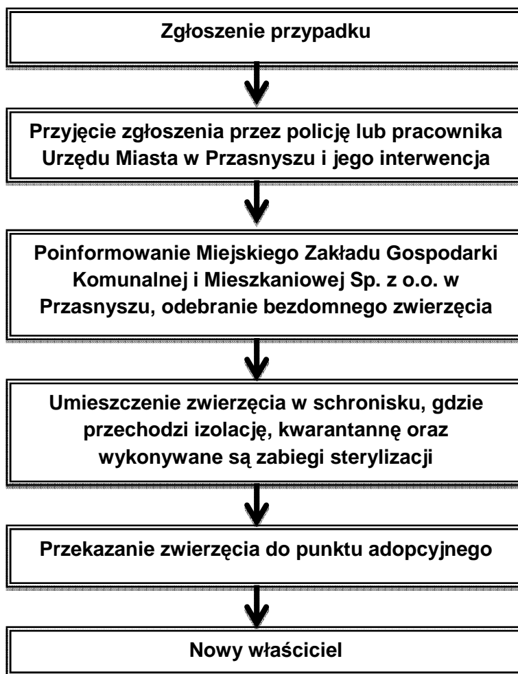
Rysunek 2. Schemat graficzny przypadku zwierzęcia pozostającego bez opieki (rannego, chorego)