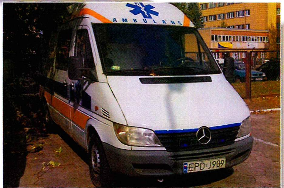
Mercedes - Benz Sprinter