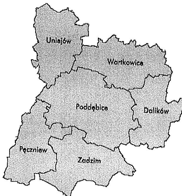
Powiat Poddębicki – rozmieszczenie gmin

Powiat Poddębicki położony jest w północno-zachodniej, krańcowej części województwa łódzkiego. Granicę północno-zachodnią powiatu stanowi granica pomiędzy województwem łódzkim a województwem wielkopolskim. Od północnego wschodu powiat graniczy z powiatem łęczyckim, od wschodu z powiatem zgierskim, od południowego wschodu z powiatem