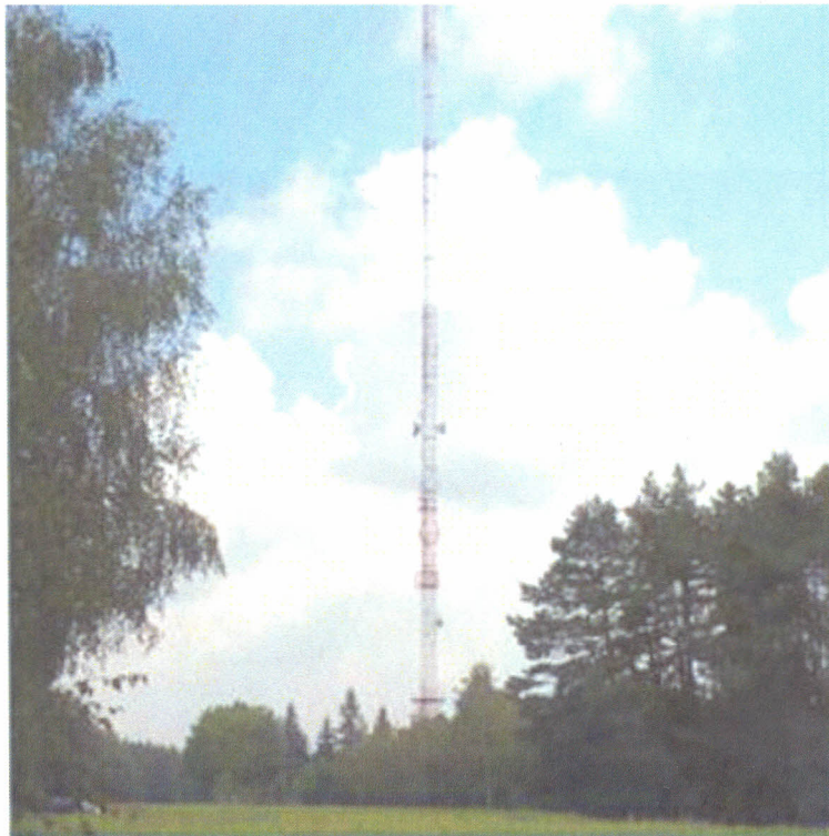
Fot. 1. RTCN Łódź/Zygry – widok obiektu