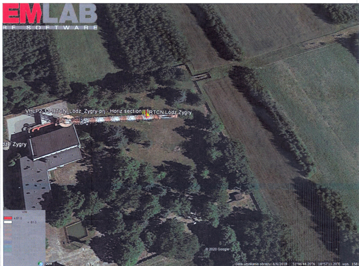
Rys. 2. Rzut poziomy rozkładu pola elektromagnetycznego anteny nowo projektowanej linii radiowej w otoczeniu RTCN Łódź/Zygry przewidzianej do zainstalowania na wysokości 218 m nad poziomem terenu.