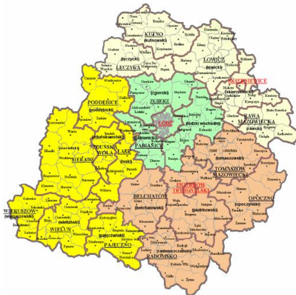
Rysunek: Położenie administracyjno-geograficzne