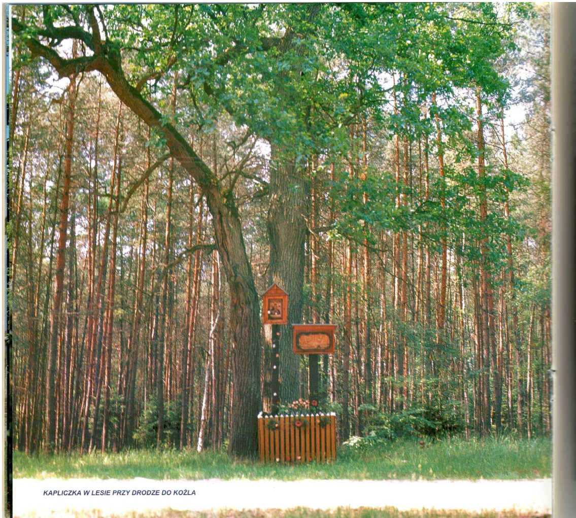
KAPLICZKA W LESIE PRZY DRODZE DO KOŻŁA

Dwie kapliczki i krzyż przydrożny oraz grupa dębów i dwie grupy modrzewi o wymiarach pomnikowych.