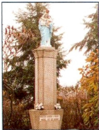
Figura Matki Bożej z Dzieciątkiem