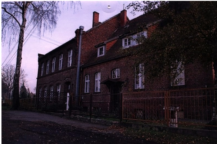
Stary budynek szkoły

Drugi budynek szkoły przekształcono w roku 2005 na mieszkania komunalne.