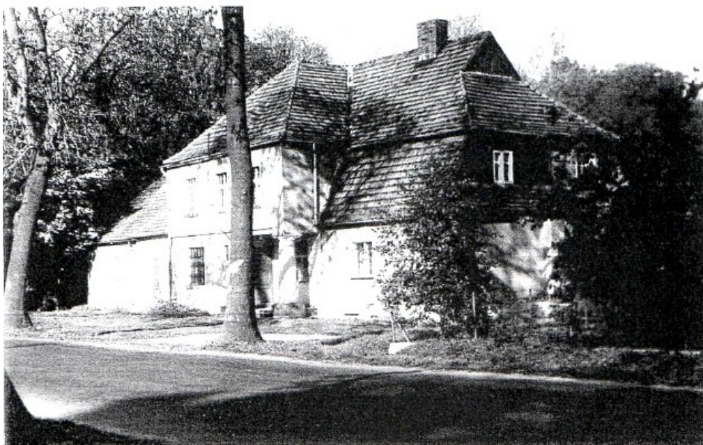
Dworek Anny Duchnickiej

Dom nr 61. położony przy drodze nr 184 Szamotuły – Ostroróg i przystanku KPKS i KSK, na pd. Od parku dworskiego. Zabudowany w końcu XIX wieku. Dawny zajazd. Murowany, otynkowany, parterowy z zagospodarowanym poddaszem i dwukondygnacyjnym ryzalitem. Dach mansardowy kryty dachówką.