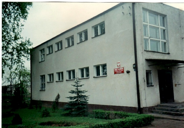
Budynek Centrum Kształcenia