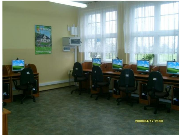
Pracownia komputerowa Centrum Kształcenia

Drugi budynek szkoły przekształcono w roku 2005 na mieszkania komunalne.