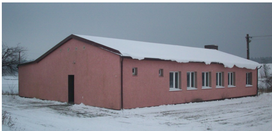
Budynek świetlicy wiejskiej

We wsi znajdują się gospodarstwa indywidualne, dwa sklepy spożywczo – przemysłowe, remiza OSP, świetlica wiejska, nieczynna stacja PKP oraz przystanki autobusowe.