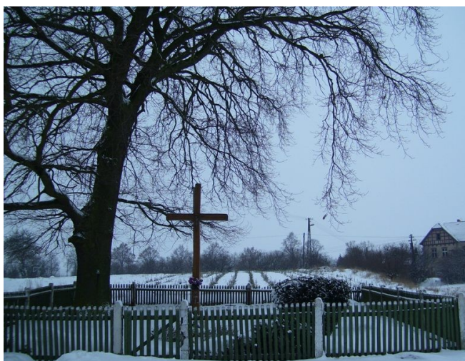
Dawny cmentarz choleryczny