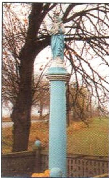
Figura Matki Boskiej Królowej Polski z Dzieciątkiem