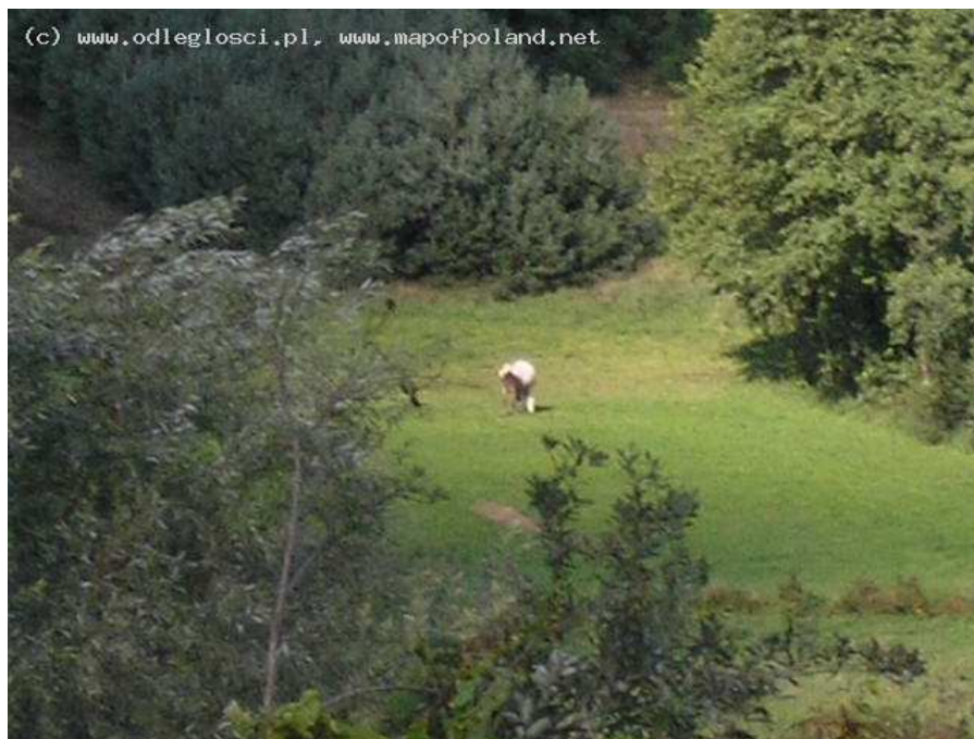
Łąka w Bielejewie