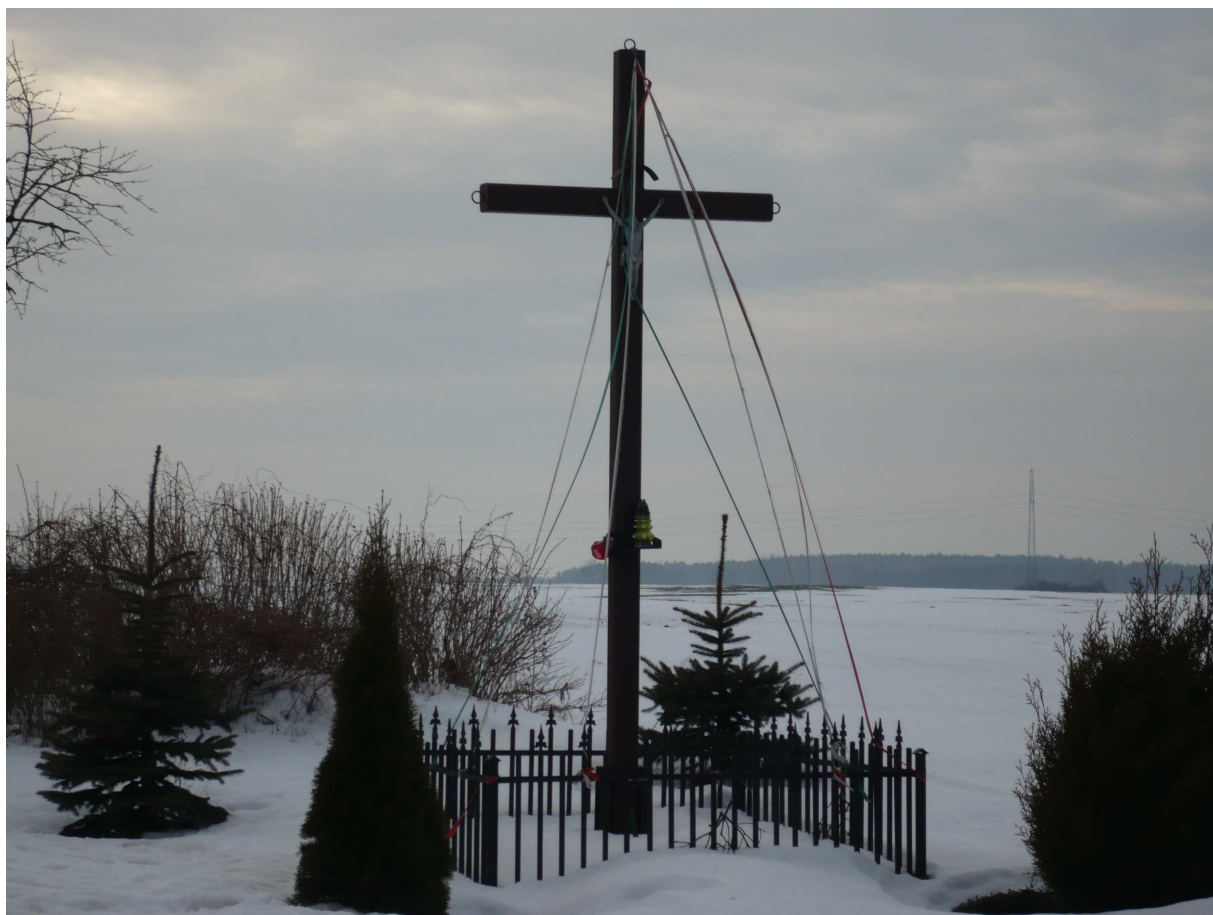
Drewniany krzyż przydrożny

Na pn.- zach. skraju wsi drewniany krzyż przydrożny.