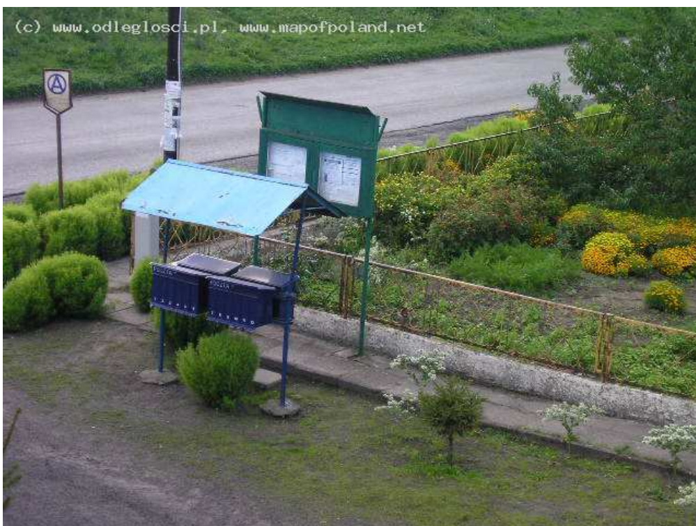
Ogródek przy Świelicy wiejskiej

Zabudowa zwarta. W latach 1953 została zawiązana spółdzielnia produkcyjna a w 1972 r. powstał Kombinat Spółdzielczy Bobulczyn, Bielejewo, Wierzchocin.