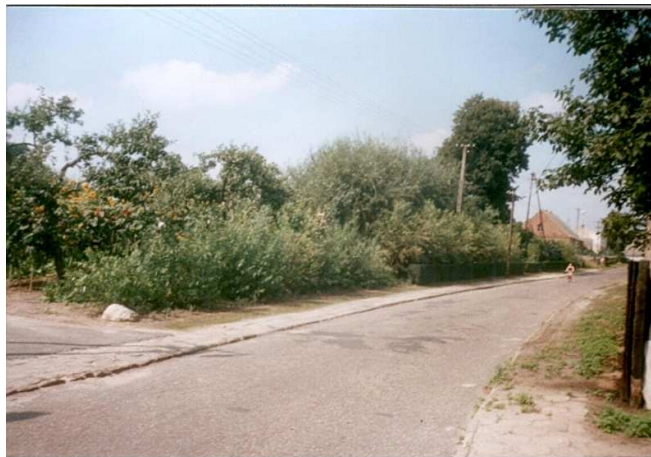
Obecny stan drogi

Jest to droga łącząca wieś Wielonek z leśniczówką Klemensowo.