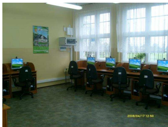
Pracownia komputerowa Centrum Kształcenia