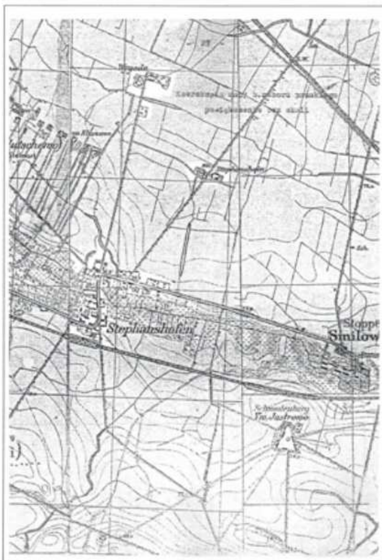
Mapa 1: Szczepankowo z czasów zaboru pruskiego