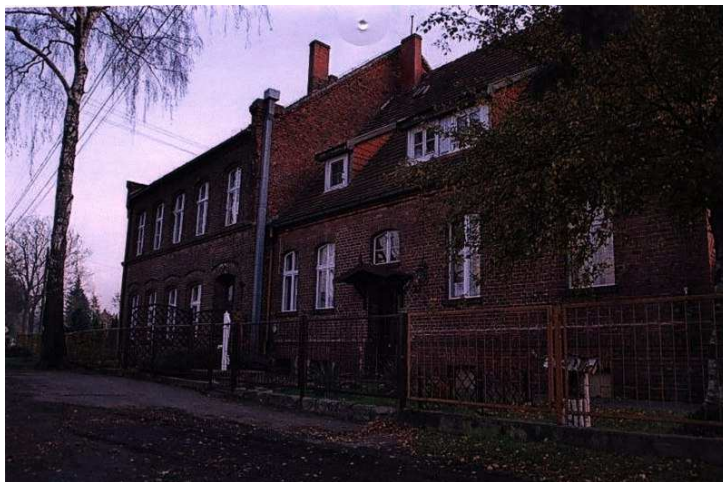
Stary budynek szkoły

Drugi budynek szkoły przekształcono w roku 2005 na mieszkania komunalne.