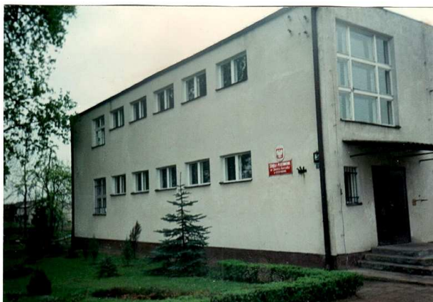
Budynek Centrum Kształcenia