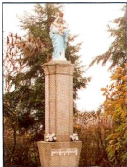
Figura Matki Bożej z Dzieciątkiem