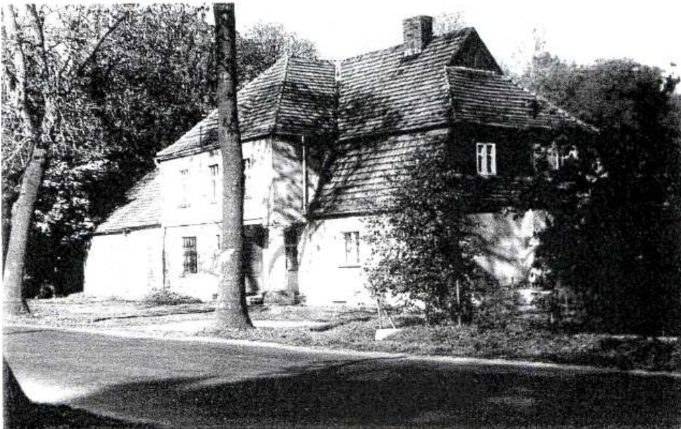
Dworek Anny Duchnickiej

Dom nr 61. położony przy drodze nr 184 Szamotuły – Ostroróg i przystanku KPKS i KSK, na pd. Od parku dworskiego. Zabudowany w końcu XIX wieku. Dawny zajazd. Murowany, otynkowany, parterowy z zagospodarowanym poddaszem i dwukondygnacyjnym ryzalitem. Dach mansardowy kryty dachówką.