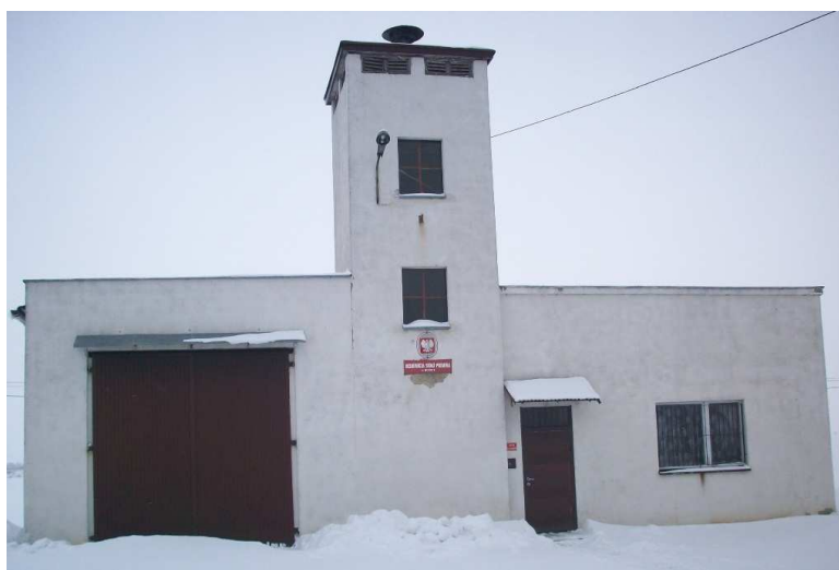
Budynek OSP Binino