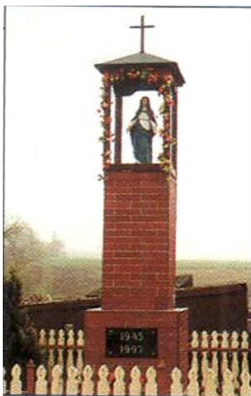
Figura poświęcona Matce Bożej