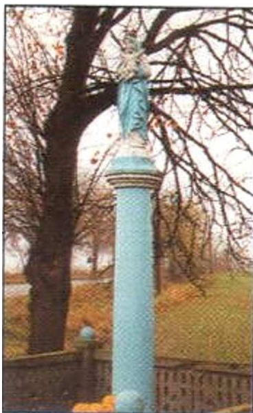
Figura Matki Boskiej Królowej Polski z Dzieciątkiem