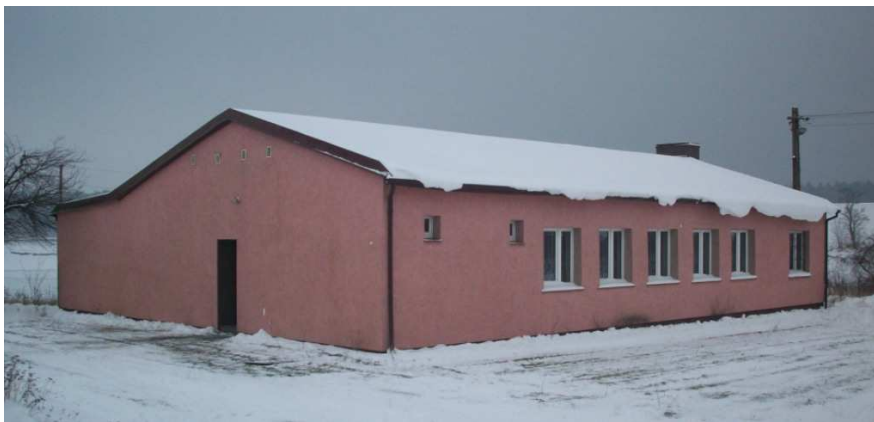
Budynek świetlicy wiejskiej

We wsi znajdują się gospodarstwa indywidualne, dwa sklepy spożywczo – przemysłowe, remiza OSP, świetlica wiejska, nieczynna stacja PKP oraz przystanki autobusowe.