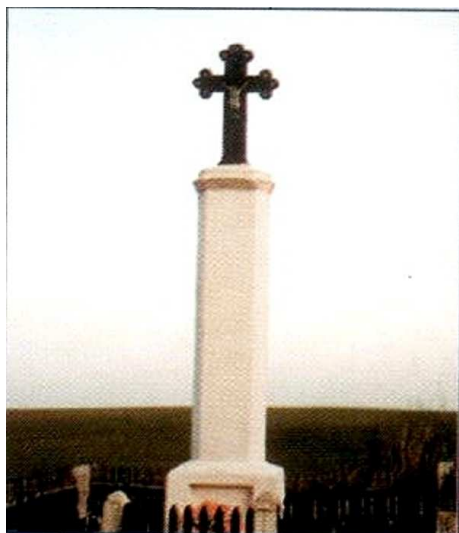
Cokół, na którym umieszczony jest krzyż