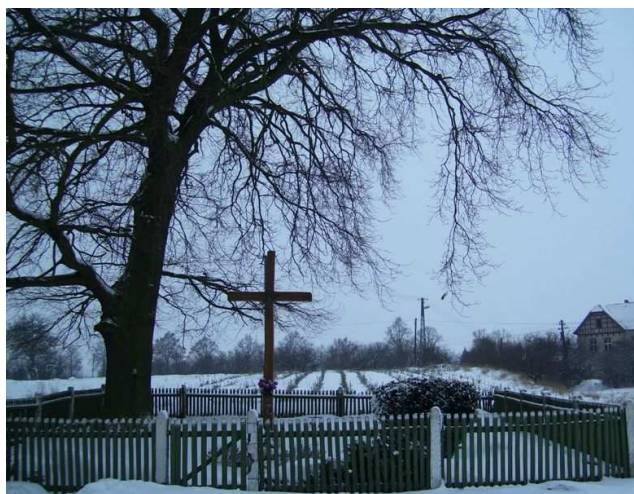
Dawny cmentarz choleryczny