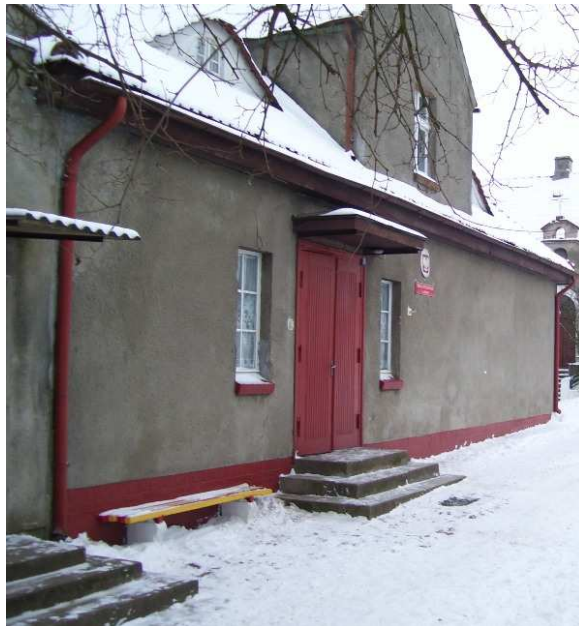
Budynek szkoły podstawowej

Filia Biblioteki Publicznej Miasta i Gminy Ostroróg, która mieści w świetlicy wiejskiej. Biblioteka została utworzona w 1948 roku jako Biblioteka gromadzka. Zatrudniała jednego pracownika. W 1975 roku podczas reformy administracyjnej Biblioteka Gromadzka została przekształcona w filię i weszła w skład struktury Biblioteki Publicznej Miasta i Gminy Ostroróg.