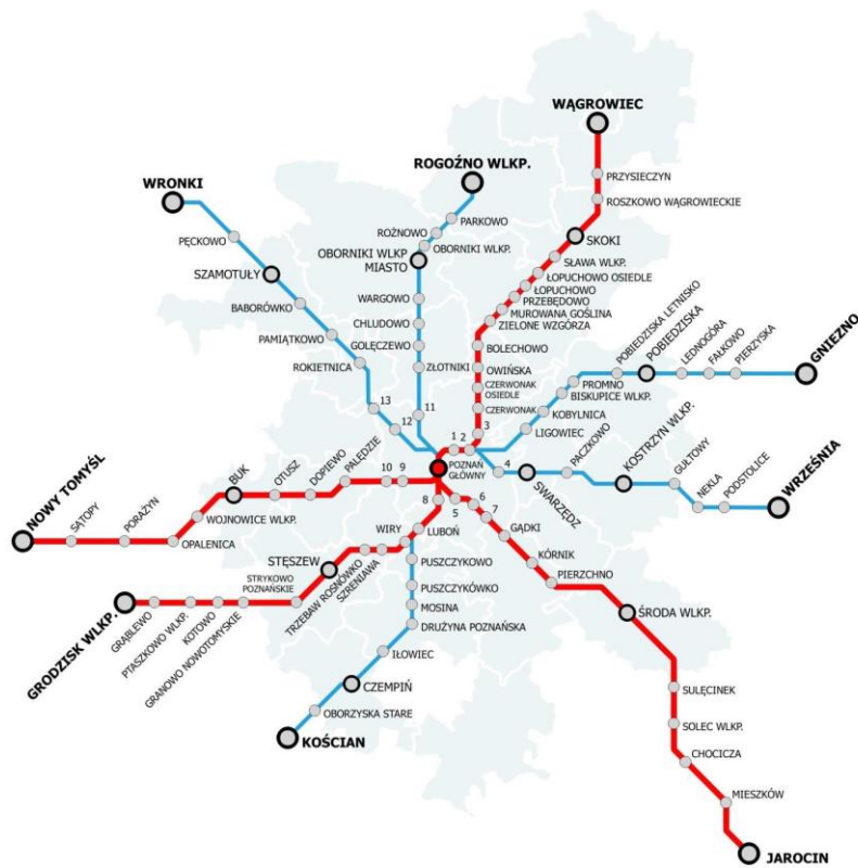
Stacje i przystanki PKM w obrębie miasta Poznań