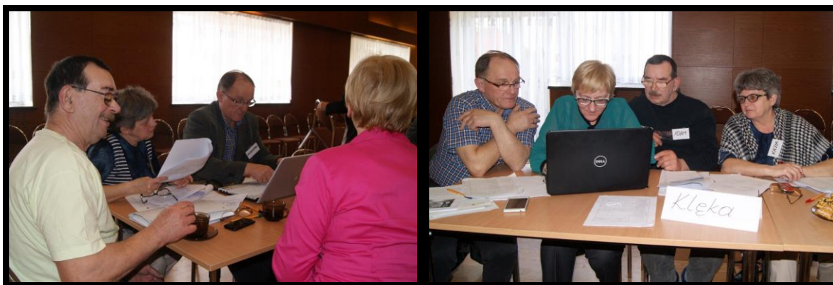
Grupa Odnowy Wsi w czasie warsztatów opracowania Sołeckiej Strategii Rozwoju. Gminny Ośrodek Kultury w Nowym Mieście nad Wartą, dnia 22 - 23.IV.2016r.