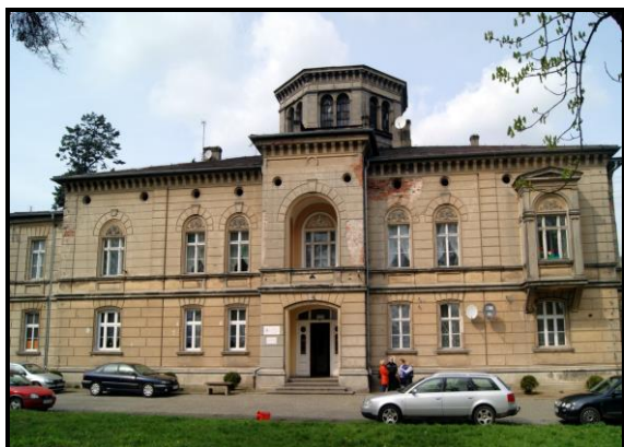
Zabytkowy pałac z końca XIX w