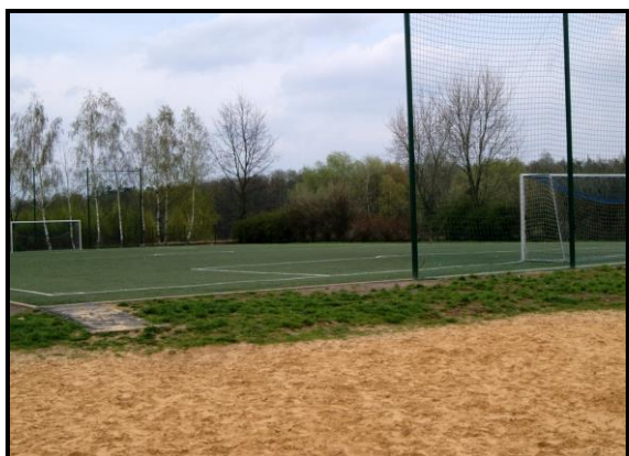
Miejsce sportu i rekreacji