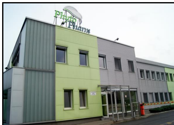
Zakład Phytopharm S.A