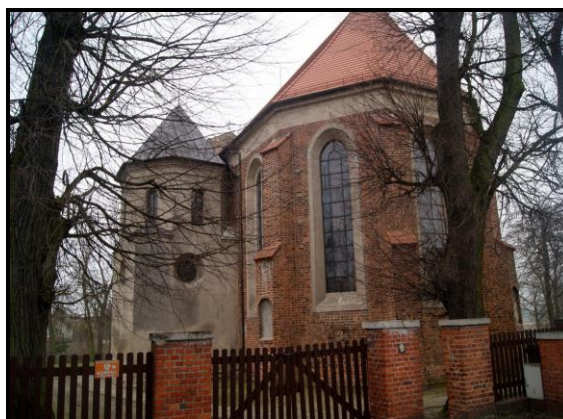
Kościół gotycki z XV w. p.w. Św. Trójcy