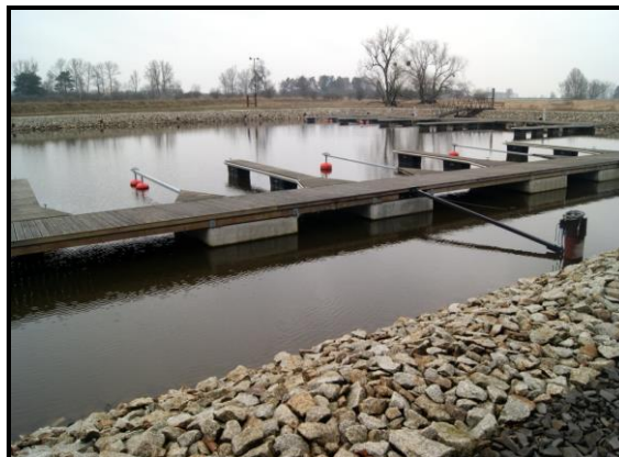
Zajazd i przystań wodniacka „Pod Czarnym Bocianem”