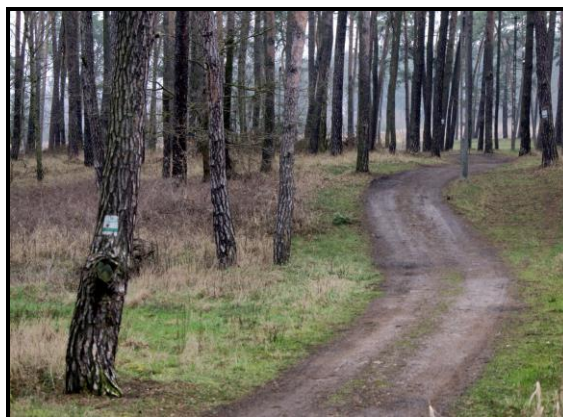
Trasa nordic walking