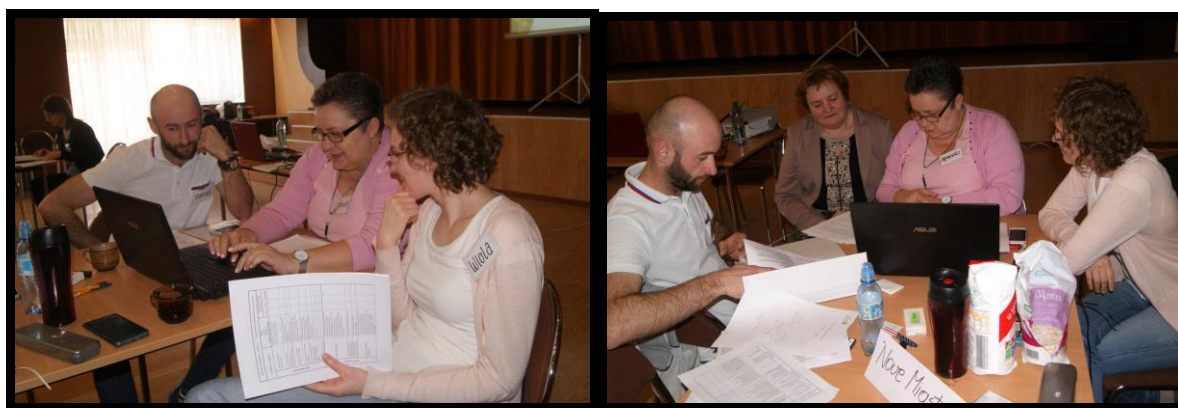
Grupa Odnowy Wsi w czasie warsztatów opracowania Sołeckiej Strategii Rozwoju. Gminny Ośrodek Kultury w Nowym Mieście nad Wartą, dnia 22-23.IV.2016r.

SOLECKA STRATEGIA ROZWOJU dla Nowego Miasta nad Wartą wypracowana przez GOW na warsztatach w ramach programu UMWW - „Wielkopolska Odnowa Wsi 2013-2020”