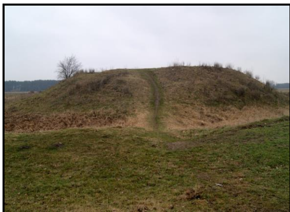
Kopiec otoczony fosą ze śladami wałów