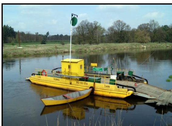
Przeprawa promowa na rzece Warta