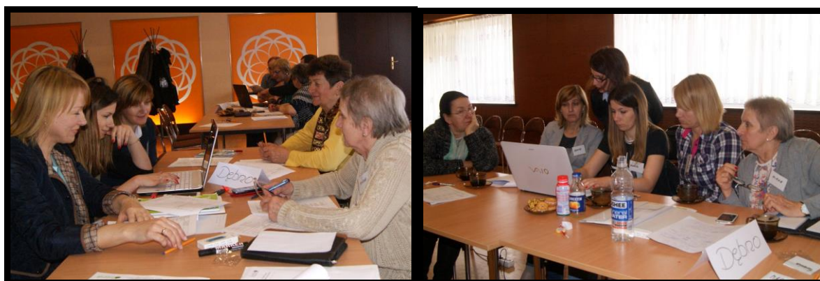
Grupa Odnowy Wsi w czasie warsztatów opracowania Sołeckiej Strategii Rozwoju. Gminny Ośrodek Kultury w Nowym Mieście nad Wartą, dnia 22 - 23.IV.2016r.