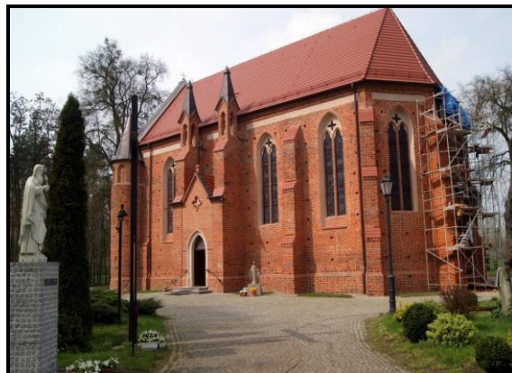
Kościół parafialny z 1447r.