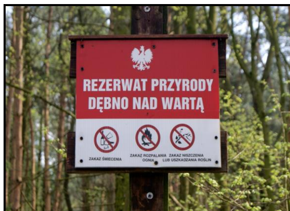
Rezerwat przyrody /Obszar Natura 2000