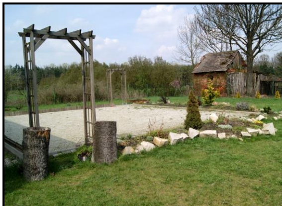
Miejsce spotkań przy świetlicy wiejskiej