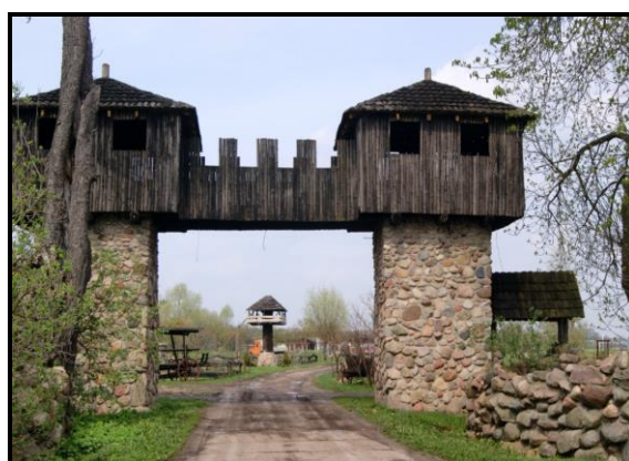
Gosp. Agroturystyczne LUTYNIA