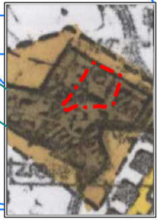
Wrys ze SUIKZP gminy Niechlów uchwalonego przez Radę Gminy Niechlów uchwałą nr XXVIII/187/01 z dnia 28 grudnia 2001r.