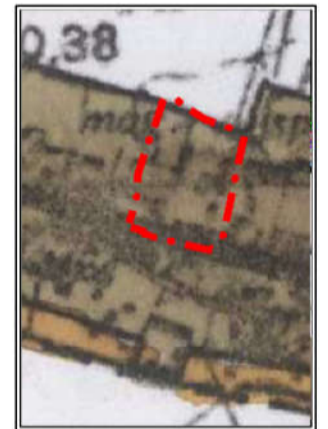
Wyrus ze SUIKZP gminy Niechlów uchwalonego przez Radę Gminy Niechlów uchwałą nr XXVIII/187/01 z dnia 28 grudnia 2001r.

EPPUM Pracownia Planistyczno-Urbanistyczna EPPUM – Marek Lempart