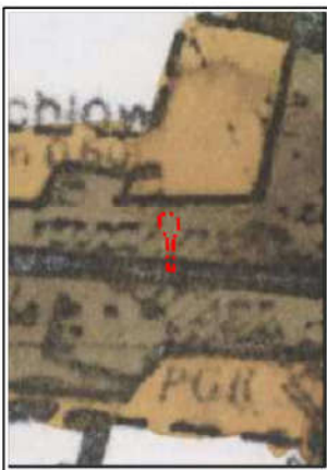
Wyrus ze SUIKZP gminy Niechlów uchwalonego przez Radę Gminy Niechlów uchwałą nr XXVIII/187/01 z dnia 28 grudnia 2001r.

KDG(1) tereny infrastruktury komunikacyjnej obejmują istniejące drogi publiczne i drogi wewnętrzne; w przypadku modernizacji infrastruktury: krótkotrwała emisja zanieczyszczeń do powietrza ze spalin, niewielki wzrost poziomu hałasu z ruchu pojazdów mechanicznych, wytworzenie odpadów