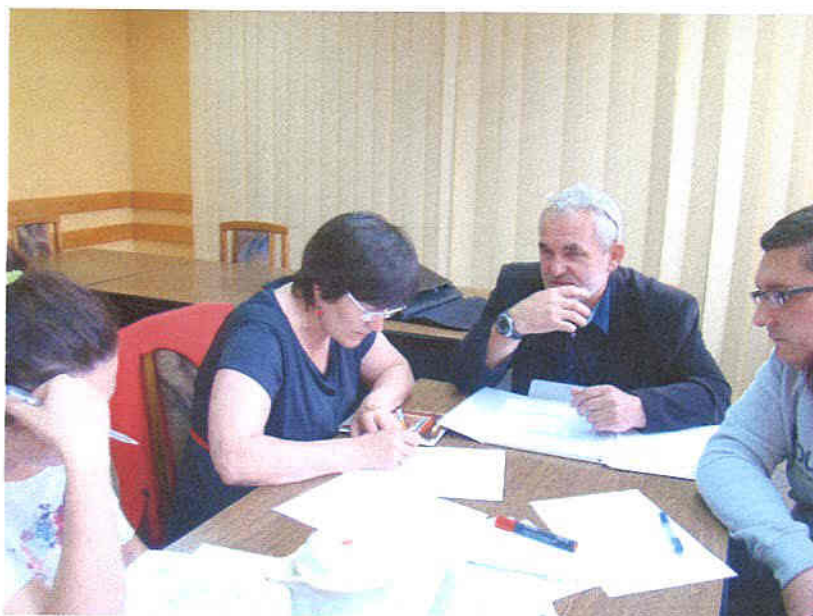
Foto z warsztatów

Niechlów to miejscowość gminna, w której ciągle się coś dzieje, a mieszkańcy mają dogodne warunki do aktywnego spędzania czasu wolnego. Dzięki działaniom wzrasta zaangażowanie młodzieży, seniorzy mają wsparcie i różnorodną ofertę rozwoju zainteresowań. Lokalna i zintegrowana z otoczeniem społeczność ma dostęp do tutejszej edukacji i kultury. Korzystając z rozwiniętej oferty rekreacyjnej, lokalnych zasobów Doliny Baryczy i infrastruktury technicznej oraz społecznej, rozwija się agroturystyka. Grupa odnowy wsi kooperuje działania i inicjatywy liderów z Niechlowa, współpracuje z organami władzy, lokalnymi przedsiębiorcami i sąsiednimi sołectwami, a tutejsze stowarzyszenie pozyskuje środki na realizację projektów sprzyjających rozwojowi wsi. Wspólna praca i zabawa przybliży mieszkańców i zacieśni więzy międzypokoleniowe. Niechlów stanowi gminne centrum aktywności, gdzie się dobrze żyje.