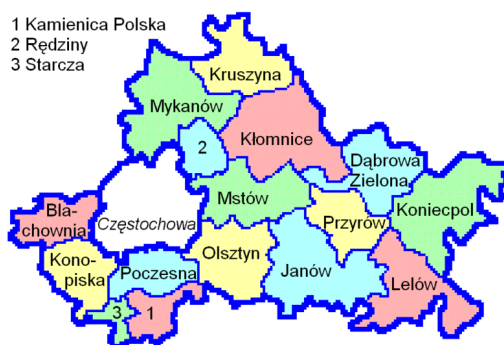
Rysunek 1. Powiat Częstochowski