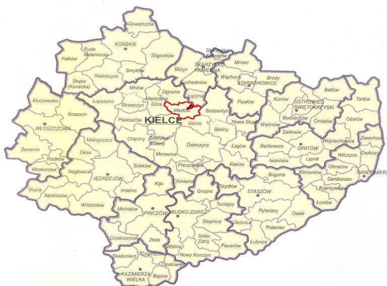
Rys. 1 - Lokalizacja sołectwa Brzezinki w Województwie Świętokrzyskim

Sołectwo Brzezinki o powierzchni 655 ha, leży w północnej części gminy Masłów nad rzeką Lubrzanką, w Dolinie Wilkowskiej, w powiecie kieleckim, woj. świętokrzyskie. Od strony północno - wschodniej graniczy z sołectwem Klonów w gminie Łączna w powiecie Skarżysko-Kamienna. W skład sołectwa wchodzi wieś Brzezinki oraz przysiółki: Smuga i Ścięgna. Dojazd od strony Kielc możliwy jest poprzez sołectwo Masłów Pierwszy (odległość 10 km), linią MPK nr 12 lub od strony Cedzyny poprzez sołectwo Mąchocice Scholasteria (odległość 15 km), linią MPK nr 10.