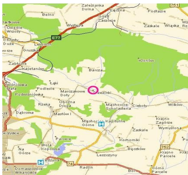
Rys. 2 - Położenie Brzezinek na terenie Gminy Masłów