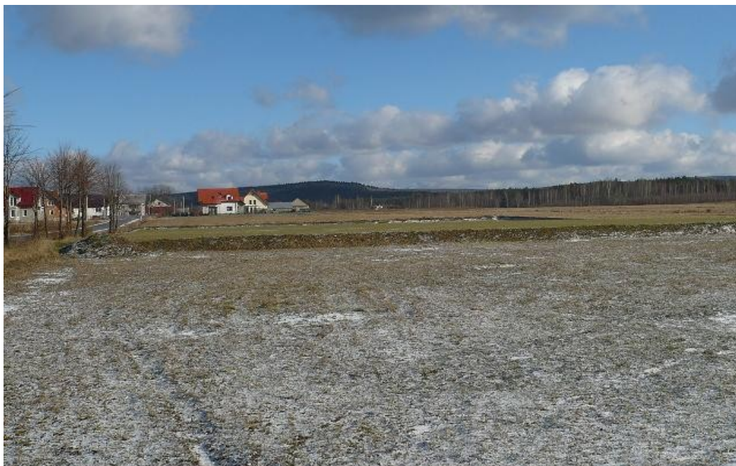
Rys. 4 – Zdjęcie terenu na którym zlokalizowany będzie kompleks sportowy

Teren planowanej inwestycji położony jest na działkach o nr ewidencyjnych 509/5, 509/6, 510, 511, 516/3, 517/3 w miejscowości Brzezinki. Jest to teren niezabudowany, nieużytków rolnych i łąk.