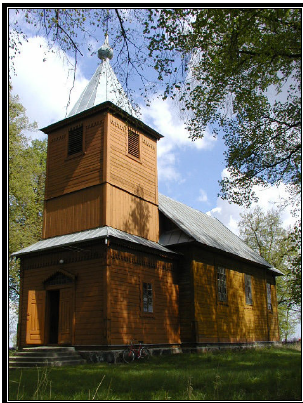
Kaplica pw. Niepokalanego Poczęcia N.P. w Bukowicach

XIX/XX, zapewne z użyciem fragmentów ikonostasu, z owalnymi obrazami w. XIX/XX, IJ1śl1. na desce: Pokłon Pasterzy i Chrzest Chrystusa. Obraz SS. Jerzy i Barbara, 2. poł. w. XIX, w ramie barokowej analogicznej jak w ołtarzu głównym. Lichtarze: 1-4. eklektyczne 4. ćw. w. XIX, o trójkątnych stopach i kanelowanych trzonach. Kociołek na wodę święconą, w. XVIII/XIX, miedziany, używany jako kropielnica. Kropielnica kamienna, stara.