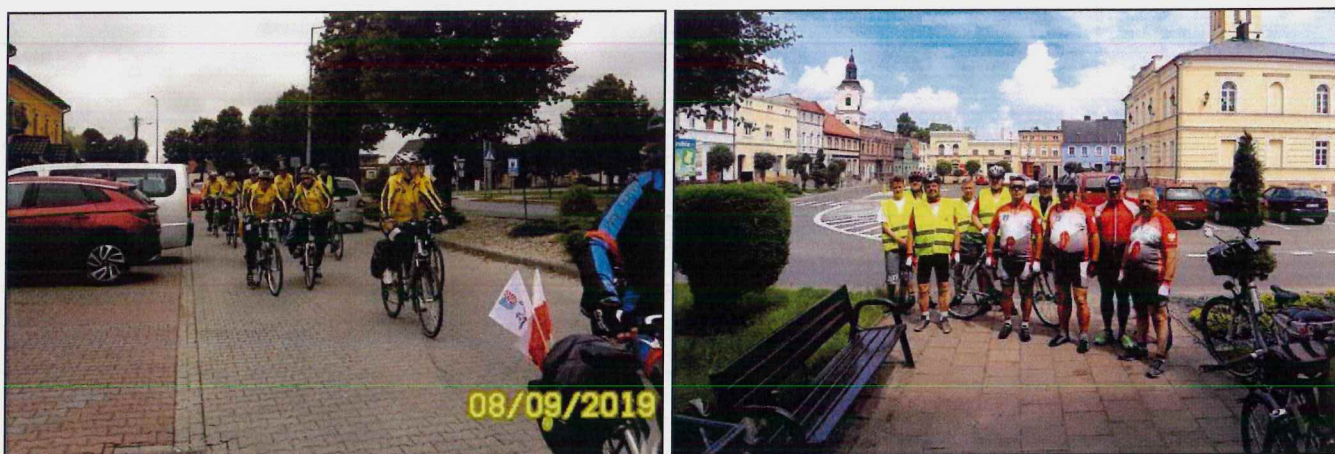
Po lewej: uczestnicy organizowanej przez Stowarzyszenie „Na Szlaku” VIII edycji „Rowerowej 80 na szlaku” (08.09.2019 r.); po prawej: rowerzyści z Krobia tuż przed rozpoczęciem udziału w Wielkopolskiej Ofensywie Rowerowej 2019 (02.06.2019 r.)