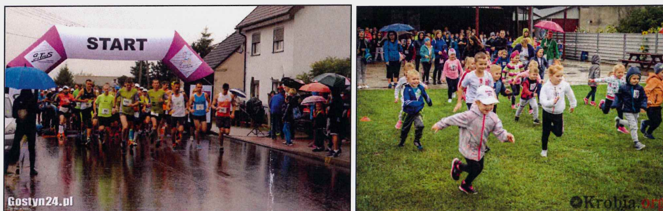
Po lewej: rozpoczęcie głównego biegu V. Półmaratonu Biskupiańskiego w Starej Krobi (07.09.2019 r.); po prawej: bieg dziecięcy w ramach V. Półmaratonu Biskupiańskiego w Starej Krobi (07.09.2019 r.)