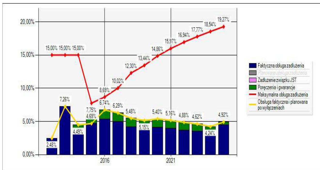
Wykres Nr 1.