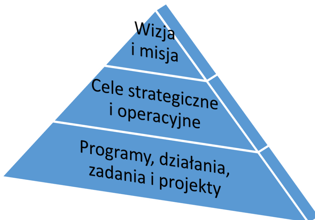
Rysunek 2. Hierarchia procesu planowania strategicznego

W niniejszym rozdziale przedstawione zostaną wizja i misja rozwoju gminy Kraszewice. Wizja powinna być rozumiana jako docelowy obraz gminy Kraszewice w przyszłości. Jest to marzenie o lepszej przyszłości, stan pożądany i oczekiwany do spełnienia, do którego będą dążyć wdrażający strategię. Wyzwaniem dla zarządzających rozwojem będzie skupienie wokół wizji różnych grup interesariuszy. Misja to nadrzędny cel rozwojowy (pierwszy stopień w hierarchii planowania strategicznego). Misję należy traktować jako precyzyjne wyrażenie dalekosiężnych zamierzeń i aspiracji, główną ideę wyznaczającą kierunek rozwoju gminy.