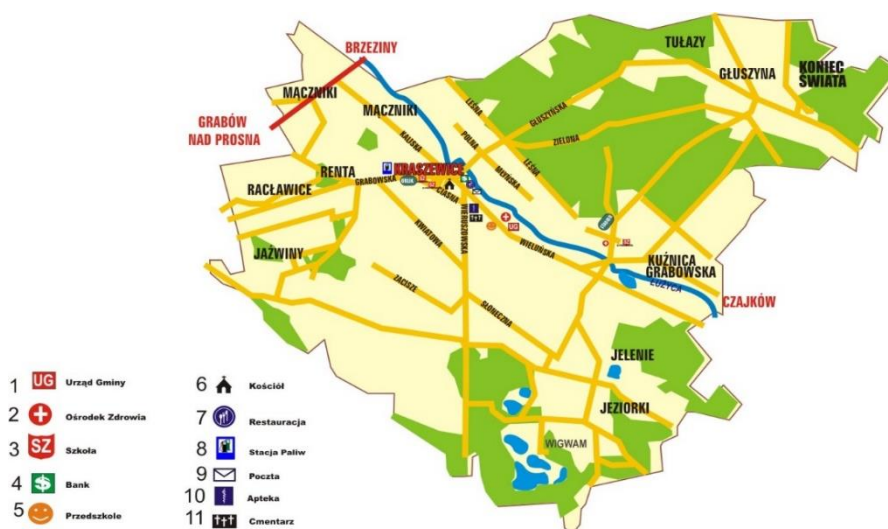
Rysunek 1. Mapa gminy Kraszewice

Na szczególną uwagę zasługuje również przysiółek Koniec Świata , który jest często odwiedzany przez turystów i stanowi ważny element w promocji całej gminy.