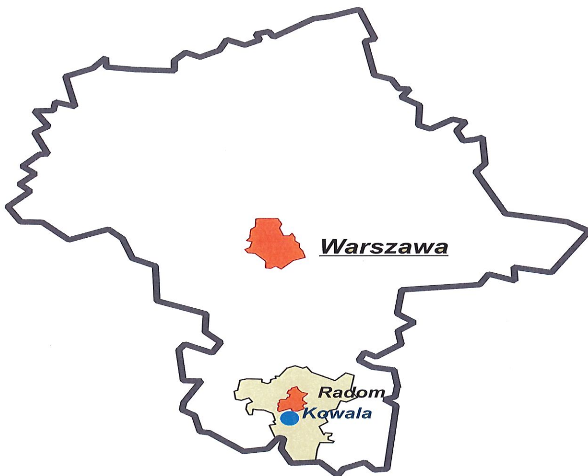
Powiat radomski i gmina Kowala na tle województwa mazowieckiego.

Kowala należy do mniejszych gmin powiatu radomskiego, natomiast pod względem ilości mieszkańców wynoszącej obecnie 11 929 osób lokuje się nieco powyżej średniej dla całego regionu.