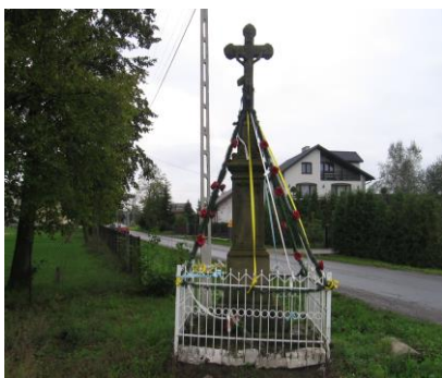
Krzyż kamienny w Bardzicach