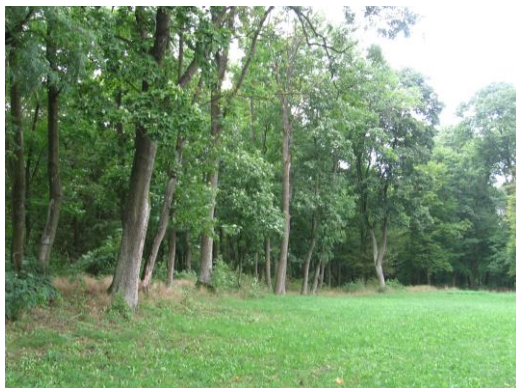
Południowa część parku w Kowali