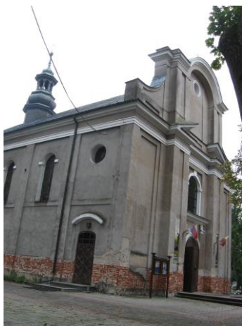
Kościół parafialny p.w. św. Wojciecha

Dzwonnica z 1 poł. XIX w. murowana, otynkowana na planie prostokąta dwukondygnacyjna. Przykryta dachem namiotowym.