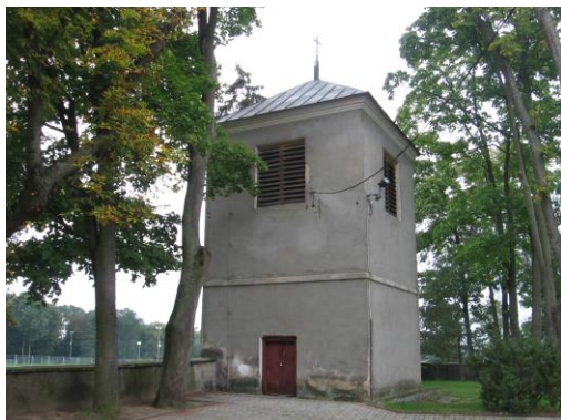
Dzwonnica przy kościele parafialnym w Kowali