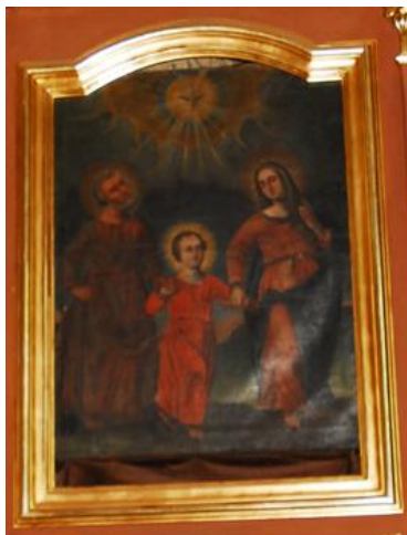
Obraz „Św. Rodzina” z XVIII w.