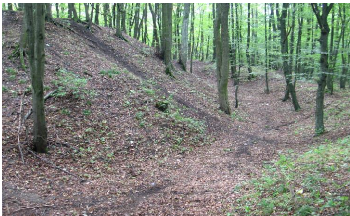
Grodzisko w Kowali-Stępcinie. Widok od strony płn-wsch. na relikty fosy i wału ziemnego