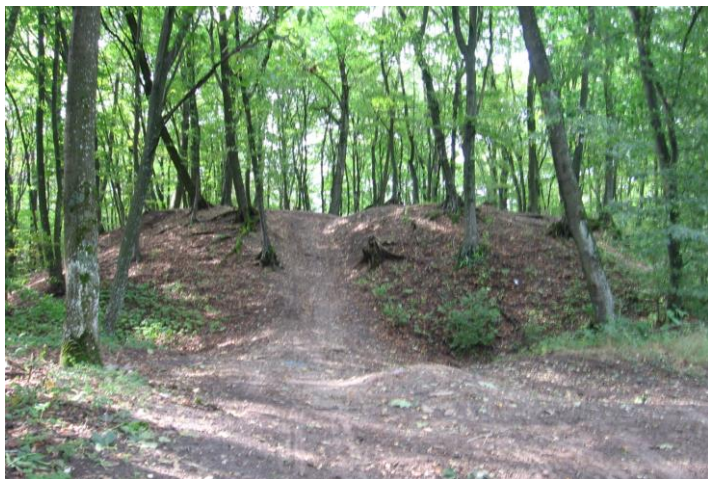
Grodzisko w Kowali-Stępcocinie. Widok od strony płd.

Jednym z najwartościowszych stanowisk archeologicznych na terenie gminy pod względem naukowo-badawczym, a także archeoturystycznym, jest grodzisko stożkowate w miejscowości Kowala-Stępcocina stan.1. Obiekt zlokalizowany jest w sąsiedztwie pozostałości zabytkowego założenia parkowego na szczycie rozległego wzgórza morenowego położonego w otulinie rozległego terenu leśnego. Posiada formę ziemnego kopca o średnicy ok.40 m, który otaczają pozostałości suchej obecnie fosy i dookólnego wału. Prace archeologiczne na omawianym stanowisku prowadzone były pod koniec lat 70-tych XX w. przez Pracownię Konserwacji Zabytków (PP PKZ) Oddział w Łodzi. Badania sondażowo – weryfikacyjne wykazały, iż obiekt funkcjonował od przełomu XIII/XIV w. do przełomu XV/XVI w. Na majdanie grodziska odkryto pozostałości spalonej, drewnianej zabudowy w typie wieży mieszkalno-obronnej. Fundatorami gródka byli prawdopodobnie przedstawiciele rodu Habdanków. Ze względu na swoje walory historyczno-krajobrazowe, obiekt po odpowiednim zagospodarowaniu terenu i przystosowaniu na potrzeby zwiedzających, mógłby stanowić jedną z ciekawszych atrakcji turystycznych związanych z dziedzictwem archeologicznym w regionie radomskim.