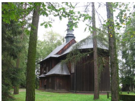
Kościół parafialny p.w. św. Andrzeja Boboli w Bardzicach

Kościół jest orientowany, konstrukcji zrębowej. Nawa o kształcie zbliżonym do kwadratu. Prezbiterium jest węższe, zamknięte trójbocznie. Od północy zakrystia została przekształcona na kruchtę. Do prezbiterium od strony południowej dobudowano zakrystię. Od zachodu dobudowano kruchtę, równą szerokości nawy. Chór muzyczny wsparty jest na dwóch słupach. Nad nawą i prezbiterium jest sufit drewniany. Dachy nad prezbiterium i nawą są dwuspadowe, kryte blachą. Wieżba dachowa posiada konstrukcję storczykową. Nad kruchtą i zakrystią są dachy pulpitowe. Wielokrotnie był remontowany.