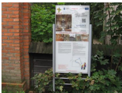
Tablica informacyjna przed kościołem parafialnym w Bardzicach