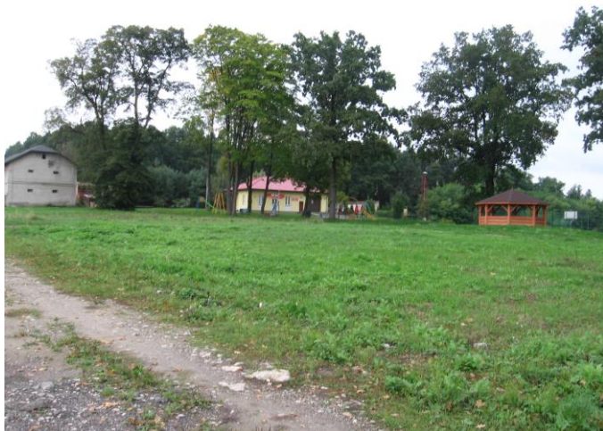
Pozostałości parku w Kosowie