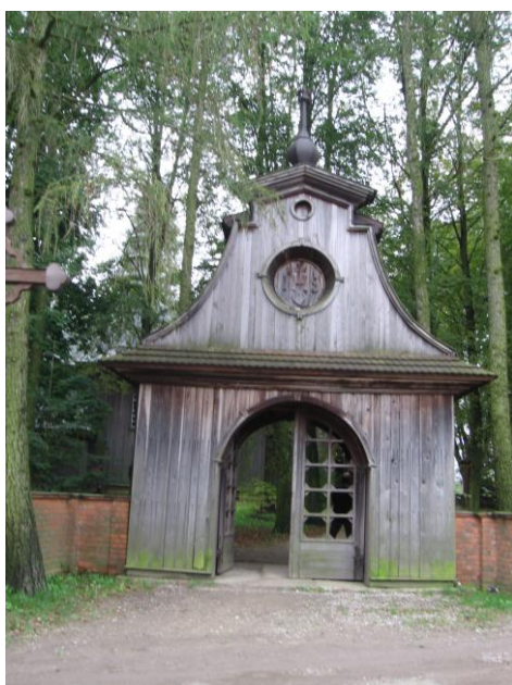
Brama północna prowadząca na teren przykościelny w Bardzicach