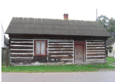
Dom w Grabinie nr 9