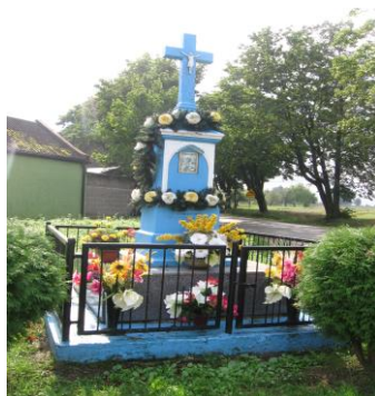
Kapliczka w Rudzie Małej