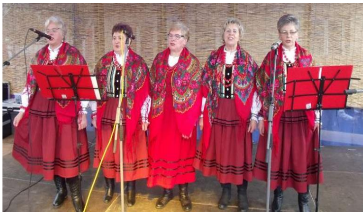
Zespół Stępcianki z Kowali-Stępciny www.gopskowala.pl

Gminny Program Opieki nad Zabytkami dla Gminy Kowala na lata 2018-2021