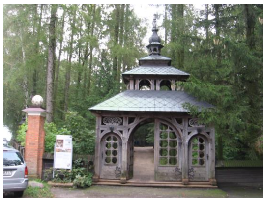
Główna brama prowadząca do kościoła w Bardzicach