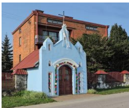
Kapliczka w Bukowcu