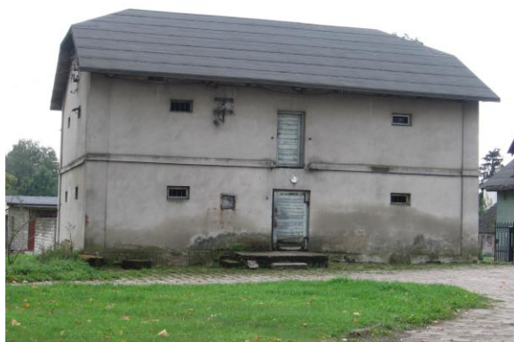
Budynek spichlerza w Kosowie

Charakterystyczną cechą krajobrazu kulturowego gminy Kowala jest znaczna liczba i różnorodność kapliczek, krzyży i figur przydrożnych, które uzupełniają dużą grupę obiektów sakralnych: znajdują się w Kowali, Bardzicach, Bukowcu, Mazowszanach, Rudzie Małej i Parznicach.