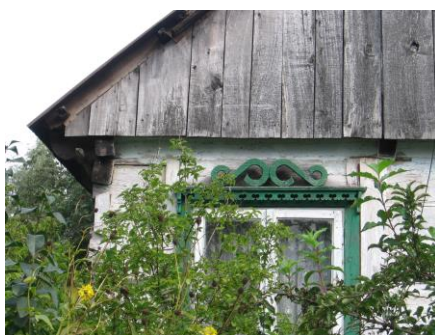
Dekoracyjne obramienie domu w Rudzie Małej