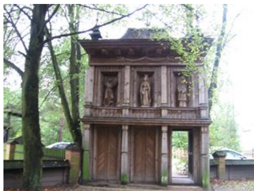
Brama południowo- wschodnia prowadząca do kościoła w Bardzicach