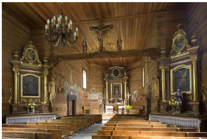
Wnętrze kościoła parafialnego w Bardzicach