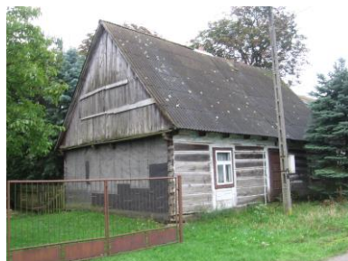
Dom w Grabinie nr 10