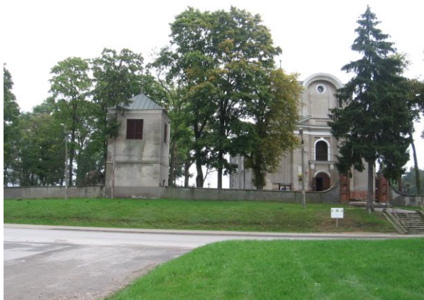
Zespół kościoła p.w. św. Wojciecha w Kowali