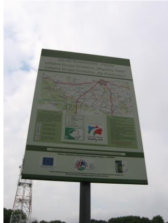
Jedna z tablic informacyjnych na trasie szlaku rowerowego

Na terenie gminy występują również szlaki piesze pttk :