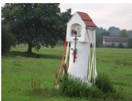
Kapliczka słupowa w Parznicach