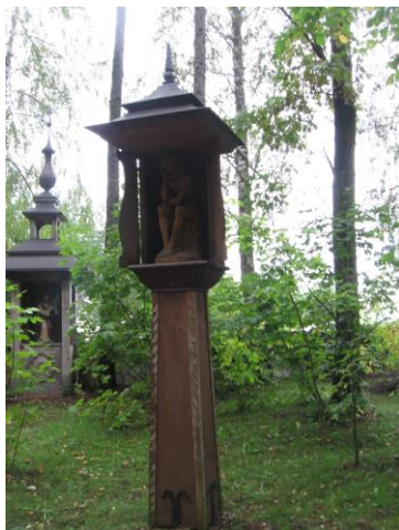
Kapliczka słupowa z figurą Chrystusa Frasobliwego w Bardzicach

W Mazowszanych i Kosowie istnieją zachowane fragmentarycznie parki. W tej drugiej miejscowości z dawnej zabudowy dworskiej i folwarcznej przetrwał budynek spichlerza o prostej architekturze. Jest murowany, otynkowany, na planie prostokąta, dwukondygnacyjny, nakryty dachem naczółkowym. Kondygnacje oddziela opaska kordonowa. Okienka prostokątne, wąskie. W parku w Kosowie zachowały się pojedyncze, stare drzewa z gatunku: dąb szypułkowy, lipa drobnolistna, klon zwyczajny, jesion wyniosły. Ruiny dawnego dworu zostały rozebrane po 2011 r., kiedy to został wykreślony z rejestru zabytków. Z uwagi na historię tego miejsca powinno się utrzymać charakter parkowy.