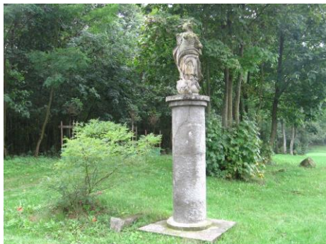
Figura MB Niepokalanie Poczętej w Kowali