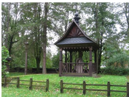
Kapliczka na terenie przykościelnym w Bardzicach