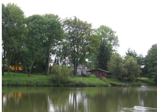
Park w Mazowszanach

Park zachował się częściowo. Pozostały drzewostan zlokalizowany jest w otoczeniu stawów. Występuje kilka gatunków drzew m.in. świerk pospolity.