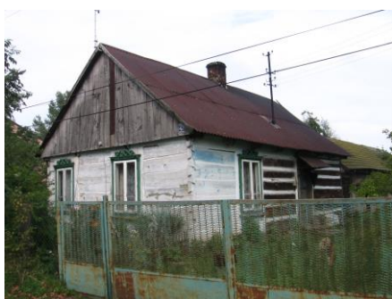
Dom w Rudzie Małej

Dawne budownictwo wiejskie reprezentują pojedyncze budynki mieszkalne, które nie zostały przebudowane, zmodernizowane, posiadają zdobienia snycerskie oraz znajdują się w dostatecznym stanie technicznym. Są to dwa domy w Grabinie, jeden w Rudzie Małej.