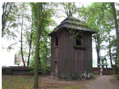
Dzwonnica przy kościele parafialnym w Bardzicach

Dzwonnica usytuowana jest w południowo- zachodnim narożniku. Zbudowana została w 2 poł. XIX w., przeniesiona do Bardzic razem z kościołem. Dzwonnice wzniesiono w konstrukcji słupowej z dachem łamanym, czterospadowym. Jest dwukondygnacyjna. Otwory okienne po jednym z każdej strony prostokątne zamknięte łukiem.