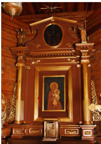
Ołtarz główny w Bardzicach z 3 ćw. XVIII w.