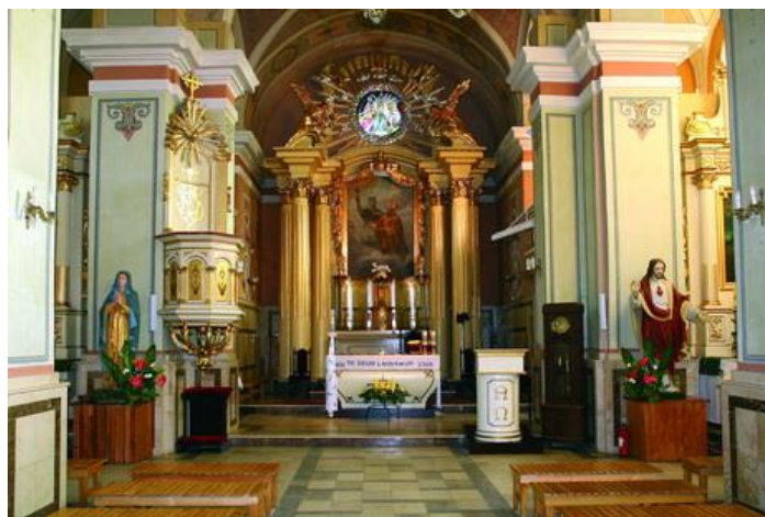
Wnętrze kościoła parafialnego w Kowali