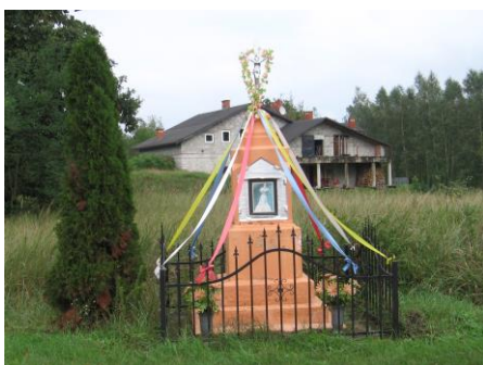
Kapliczka wnękowa w Rożkach