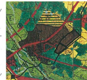
Granice terenu objętego planem

Wyrys ze studium uwarunkowań i kierunków zagospodarowania przestrzennego gminy Kołbiel - kierunki. Uchwała Nr XIII/78/2008 Rady Gminy w Kołbieli z dnia 29 lutego 2008 r.