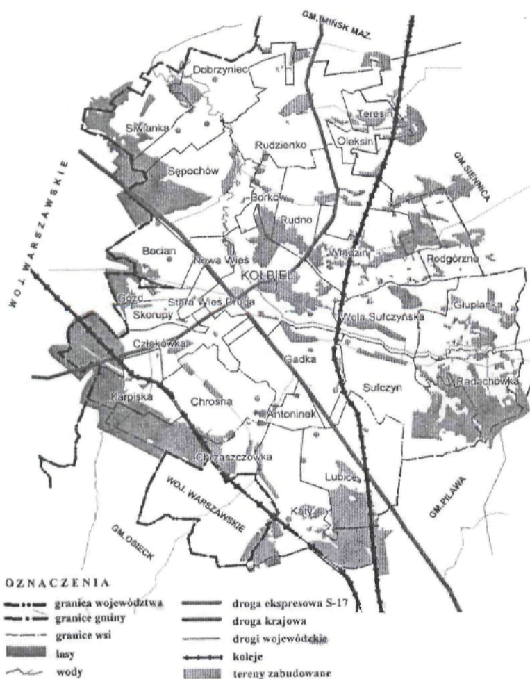
Mapka Gminy Kołbiel

Miejscowość Teresin jest jedną z dwudziestu ośmiu miejscowości Gminy Kołbiel położonej w województwie mazowiecki, w powiecie otwockim. sąsiaduje z miejscowościami : Rudno , Rudzienko, Oleksin , oraz Chełst (Gmina Siennica).