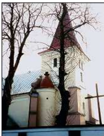
Kościół Św. Małgorzaty w Kiernozi