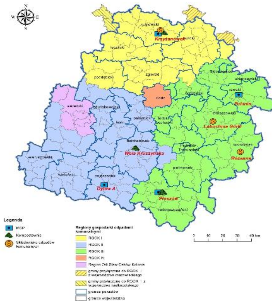
Plan gospodarki odpadami dla województwa łódzkiego na lata 2016-2022 z uwzględnieniem lat 2023-2028

Gmina Kiernozia wchodzi w skład Regionu I. Zgodnie z założeniami ww. planu niesegregowane (zmieszane) odpady komunalne, odpady zielone oraz pozostałości z sortowania odpadów komunalnych przeznaczonych do składowania z terenu Gminy mogły być kierowane do następujących regionalnych instalacji: Region I (RGOK I),