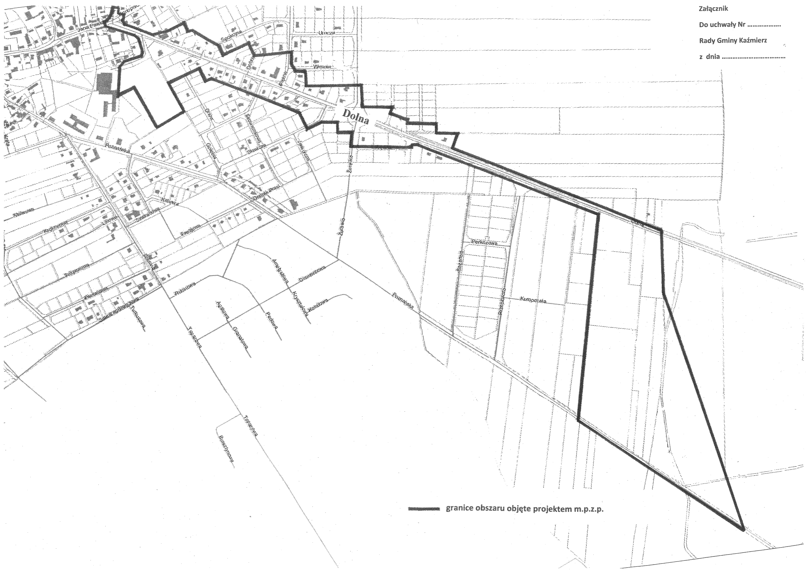
— granice obszaru objęte projektem m.p.z.p.