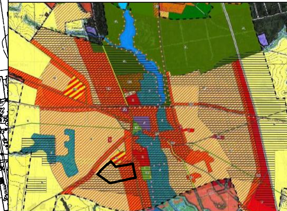
WYRYS ZE STUDIUM UWARUNKÓW I KIERUNKÓW ZAGOSPODAROWANIA PRZESTRZENNEGO GMINY KAŻMIERZ