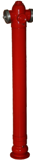
Na zdjęciu DN 150