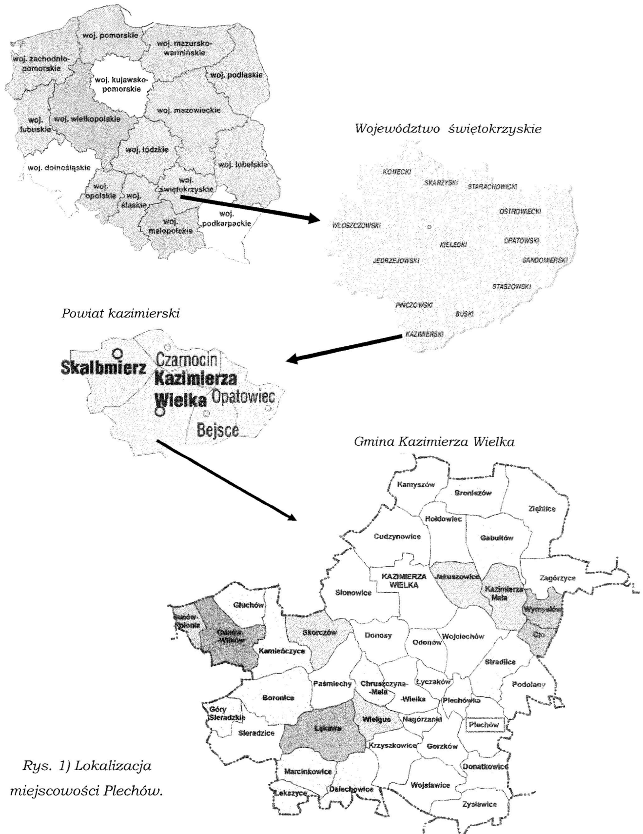
Rys. 1) Lokalizacja miejscowości Plechów.

glebach lessowych. Przeważa tu krajobraz rolniczy z licznymi terenami zadrzewionymi, oraz położonymi w dolinie łąkami.