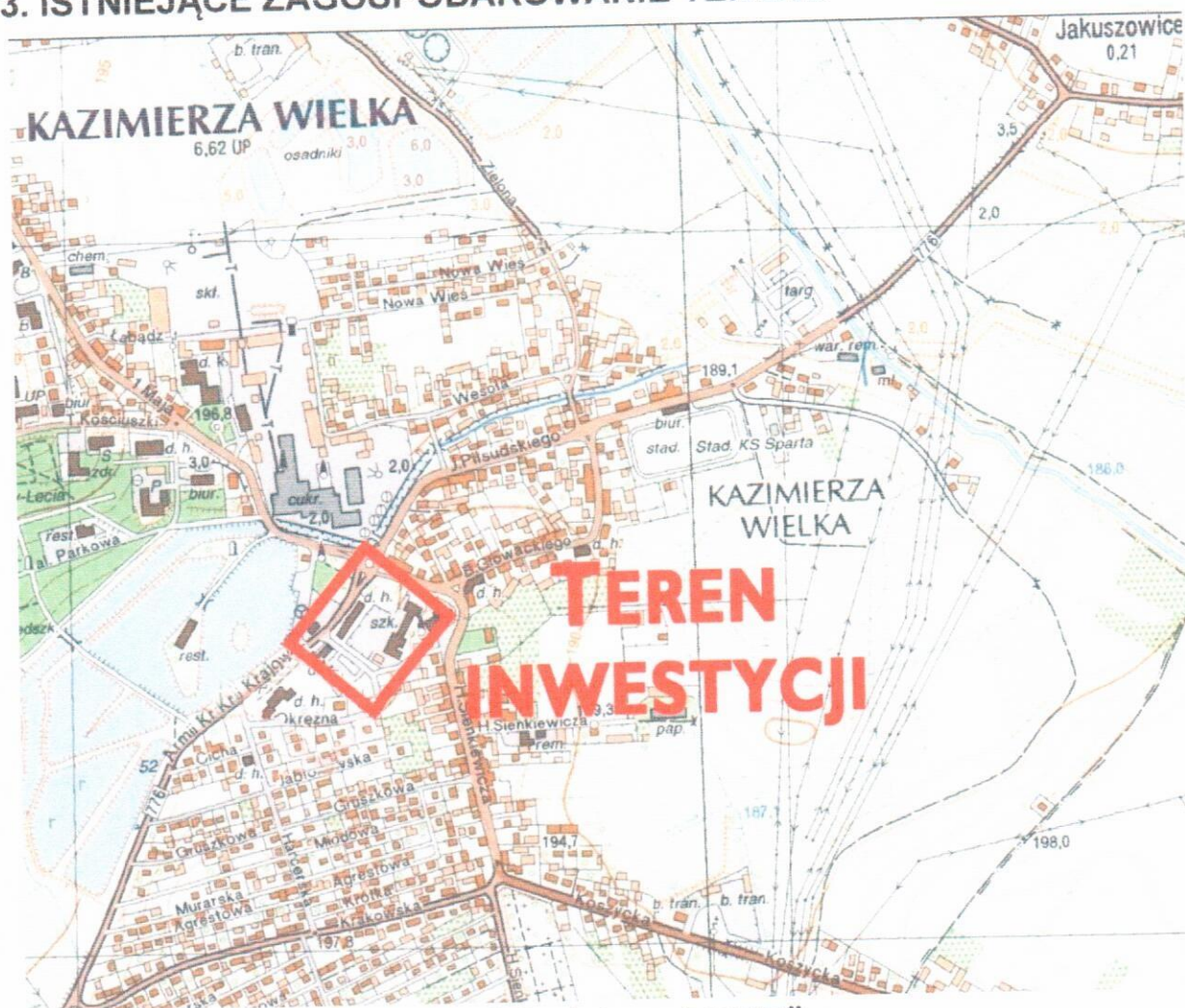
Rys. Lokalizacja terenu inwestycji

Teren inwestycji zabudowany jest budynkiem użyteczności publicznej – obiektem Samorządowej Szkoły Podstawowej nr 1 im. Hugona Kołłątaja w Kazimierzy Wielkiej. Teren wokół budynku jest w większości zagospodarowany, znajduje się tu również wielofunkcyjne boisko szkolne oraz dużo terenów uporządkowanej zieleni w formie trawnika. Na terenie inwestycji znajdowały się urządzenia Palcu Zabaw, jednak w wyniku wieloletniej eksploatacji z uwagi na bezpieczeństwo dzieci zostały rozebrane a teren po Placu wyrównany. Obecnie nie znajdują się tu żadne urządzenia przeznaczone do zabaw dla dzieci. W sąsiedztwie inwestycji zlokalizowane są budynki usługowe, sakralne a także tereny mieszkaniowe – zabudowa wielorodzinna i jednorodzinna.