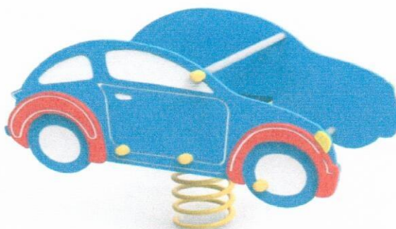
Rysunek poglądowy PODSTAWOWE