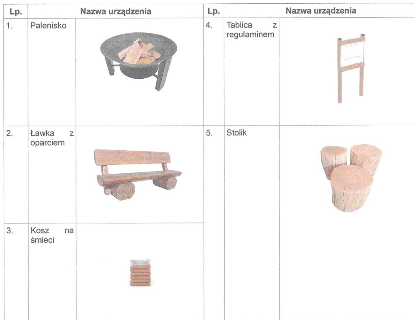
Tabela nr 2

Uwaga: Lokalizacja elementów wyposażenia placu biwakowego wskazana na rys. SW-01. Należy zachować spójną stylistykę oraz kolorystykę wszystkich elementów wyposażenia placu.