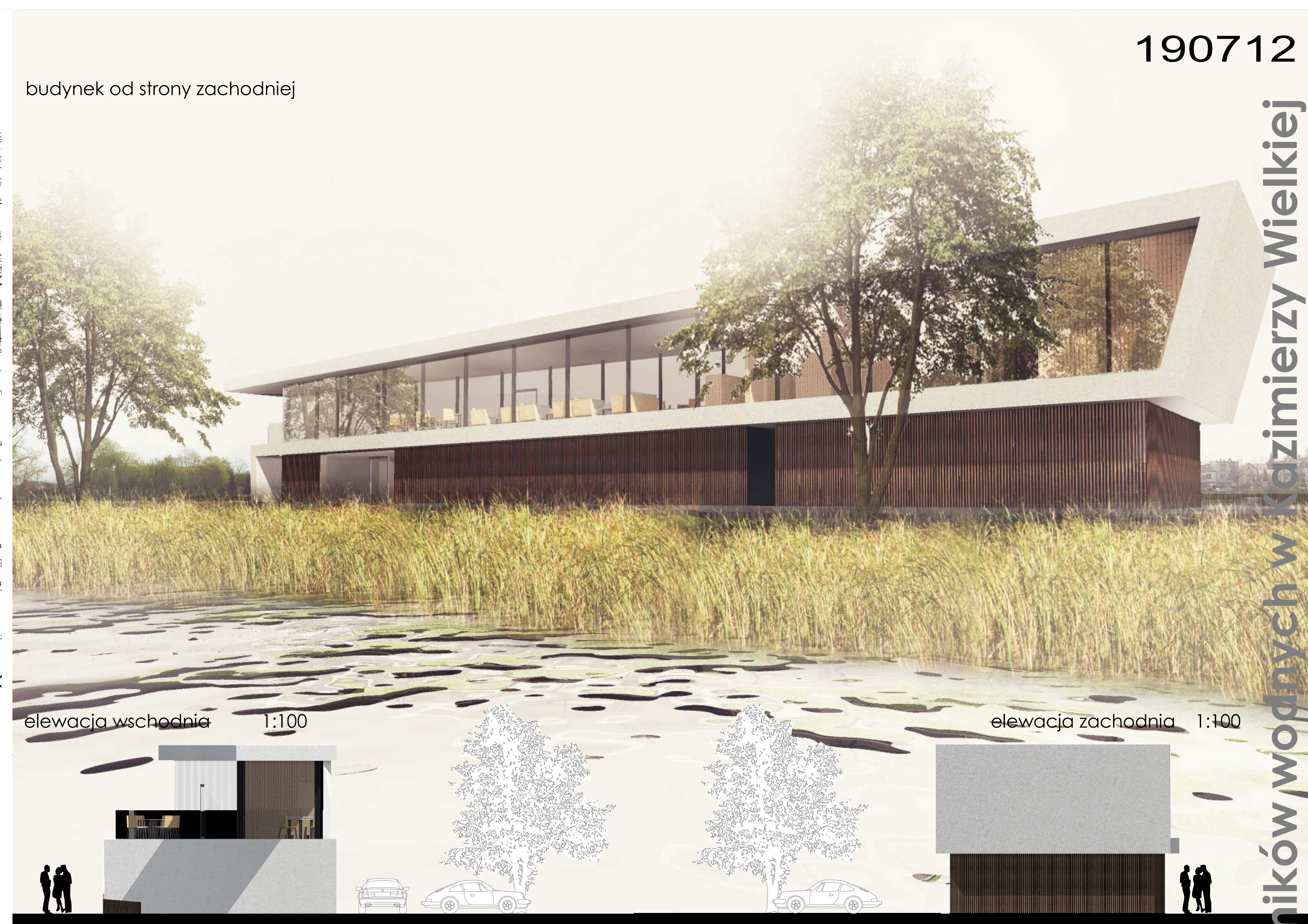
elevacja wschodnia 1:100