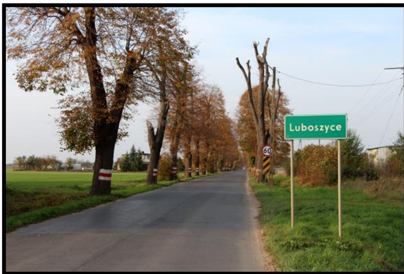
WJAZD DO WSI ALEJA LIPOWA WZDŁUŻ DROGI