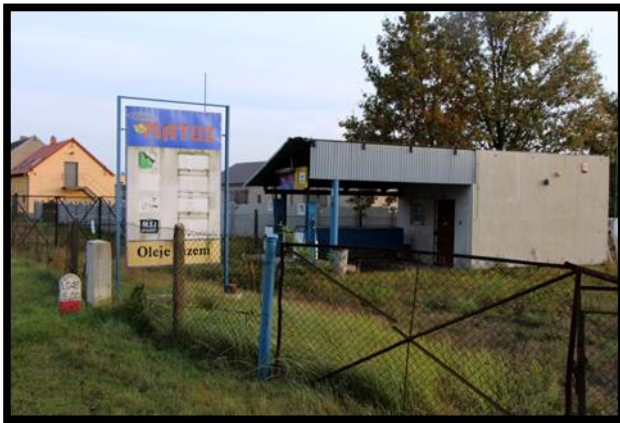
NIECZYNNNA STACJA BENZYNOWA