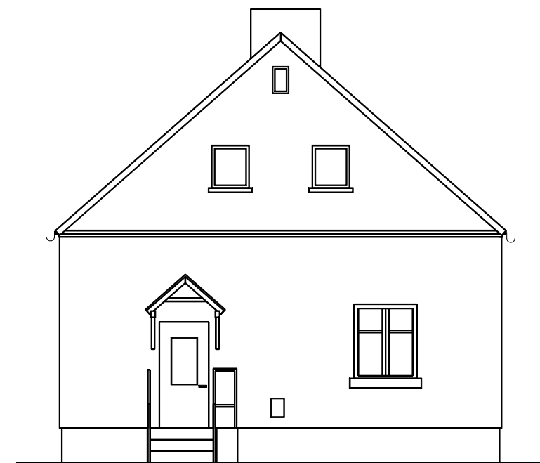
Elewcja frontowa - południowa