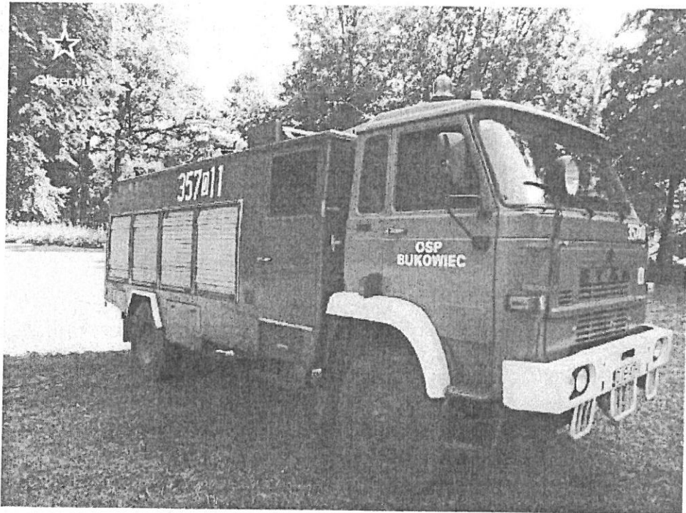
STAR 244 4x4 GBM 2500L STRAŻ wóz strażacki pożarniczy straż pożarna