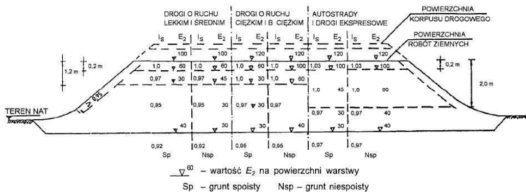
Rysunek 3 – Wartości wymagane w nasypach: wskaźnika zagęszczenia I_s i wtórnego modułu odkształcenia E_2 , megapaskali

Dodatkowo można sprawdzić nośność warstwy gruntu podłoża nasypu na podstawie pomiaru wtórnego modułu odkształcenia E_2 zgodnie z PN-02205:1998 [4] rysunek 3.