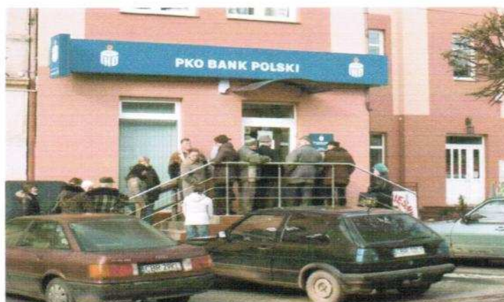
Fot.6. Oddział Banku PKO w dniu otwarcia tj.16 lutego 2009 r. przy ul. Głównej