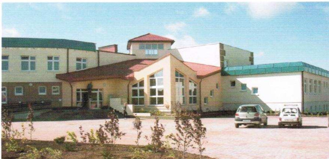
Fot. 2. Budynek Gimnazjum im. Mikołaja Kopernika

W Jabłonie Pomorskim znajduje się także Zespół Szkół ( prowadzony przez powiat), w ramach którego kształcą się młodzież i dorośli: w zasadniczej szkole zawodowej, liceum ogólnokształcącym, liceum profilowanym i technikum.