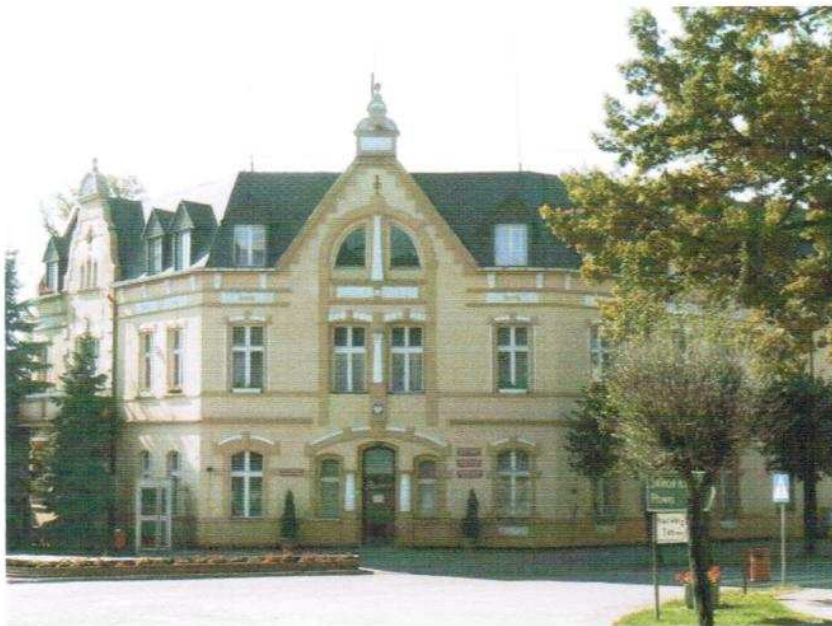
Fot.5. UMIG – promocja, Budynek Urzędu Miasta i Gminy w Jabłonowie Pomorskim.

Inne instytucje na terenie miasta: Gminne Centrum Informacji, Miejsko Gminny Ośrodek Pomocy Społecznej, punkt stacjonującej karetki pogotowia ratunkowego oraz gabinet stomatologiczny i rehabilitacyjny mieszczące się w budynku przy ul. Głównej 22.