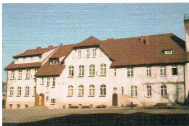
Fot.1. Budynek Szkoły Podstawowej im. Janusza Kusocińskiego w Jabłonie przy ul. Kościelnej.

Wychowanie przedszkolne odbywa się w Publicznym Przedszkolu w Jabłonie Pomorskim w budynku zmodernizowanym i rozbudowanym, który oddano do użytku w roku 2006. Wykształcenie na poziomie podstawowym i gimnazjalnym zapewniają: Publiczna Szkoła Podstawowa im. Janusza Kusocińskiego w Jabłonie Pomorskim zlokalizowana przy ul. Kościelnej oraz Publiczne Gimnazjum im. Mikołaja Kopernika w Jabłonie Pomorskim zlokalizowane przy ul. Słonecznej z salą gimnastyczną oraz boiskiem sportowym. Na zapleczu gimnazjum znajduje się stadion sportowy. Szkoła Podstawowa w Jabłonie Pomorskim jest po generalnym remoncie, który zakończono w miesiącu wrześniu 2007 roku.