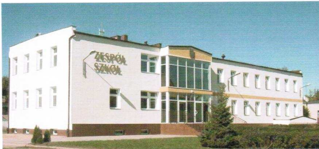
Fot.3. Budynek Zespołu Szkół oddany do użytku w 2005 roku.

Bogate tradycje, wysoko wykwalifikowana kadra pedagogiczna, a także możliwość praktycznego kształcenia, stanowią zachętę dla uczniów z miasta i gminy oraz gmin ościennych.