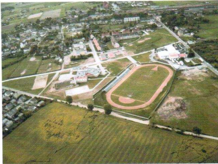
Fot.4. Jabłonowo Pomorskie z lotu ptaka, kompleks sportowy przy ulicy Słonecznej.

Dzięki tym sportowym inwestycjom Jabłonowo Pomorskie stało się sportową stolicą powiatu, trenują u nas pasjonaci Filipińskich Sztuk Walki Dolce Pares Polska, mamy bokserów – juniorów, którzy zajmują czołowe miejsca na turniejach, piłkarzy i wicemistrza Europy juniorów w kolarstwie. Przy szkołach działają Uczniowskie Kluby Sportowe, dzięki nim młodzież rozwija swoje zainteresowania sportowe.