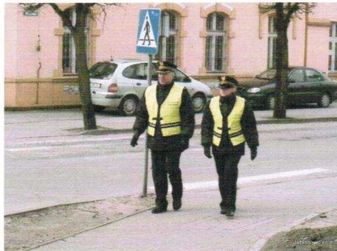
Fot. 7. Pracownicy Straży Miejskiej podczas pracy.

Na poprawę bezpieczeństwa i porządku także wpływ będzie miała powołana w roku 2008 Straż Miejska.