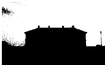
1. Ilustracja: Pałac w Strzyżowie

tu murowany dwukondygnacyjny pałac, który zachował się do dnia dzisiejszego.