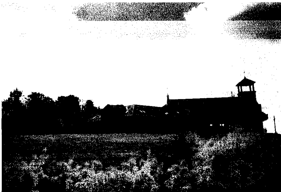
Rysunek 3 Kościół w budowie przy ulicy Słonecznej