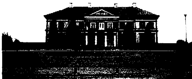
Rysunek 1 Pałac w Strzyżowie

a później kijowskim. W latach 1762 – 1786 zbudowano tu murowany, dwukondygnacyjny pałac, który zachował się do dnia dzisiejszego.