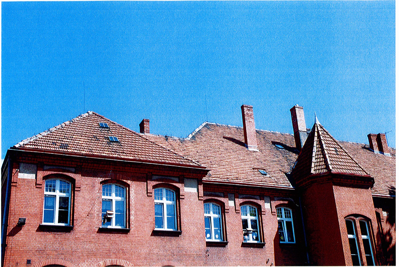
Fot. 1. Widok budynku we fragmencie od strony południowo-zachodniej