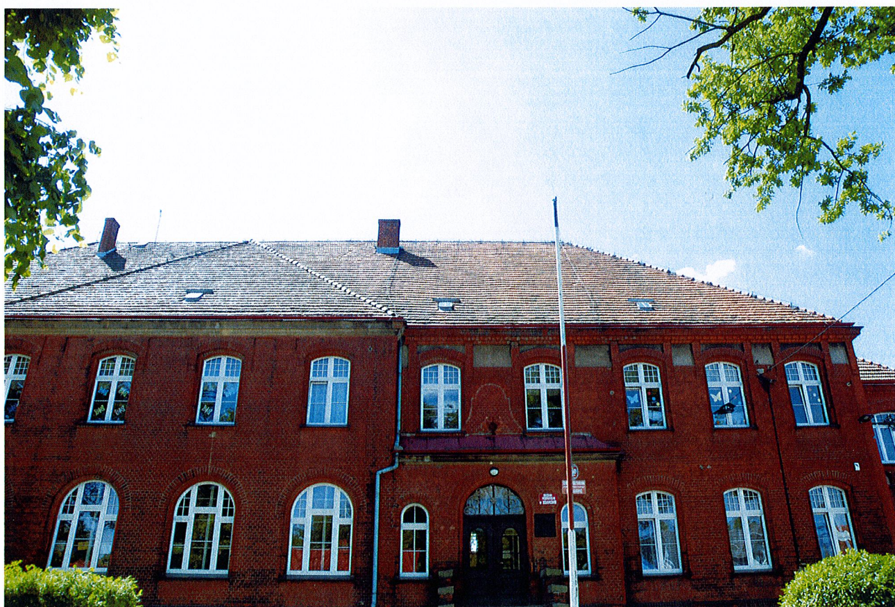
Fot. 6. Widok budynku we fragmencie od strony północnej