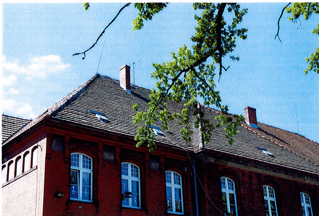
Fot. 5. Widok budynku we fragmencie od strony północno-wschodniej