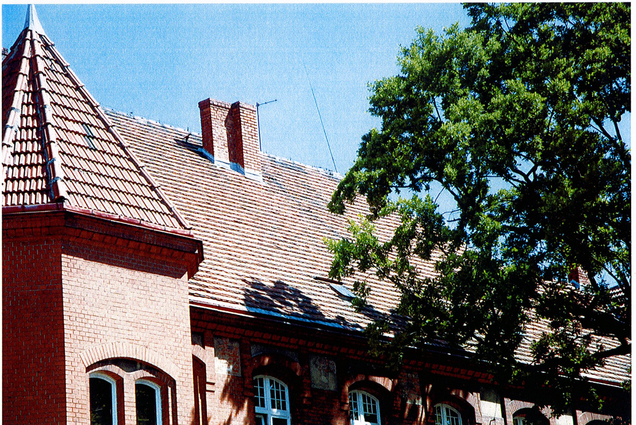
Fot. 2. Widok budynku we fragmencie od strony południowej