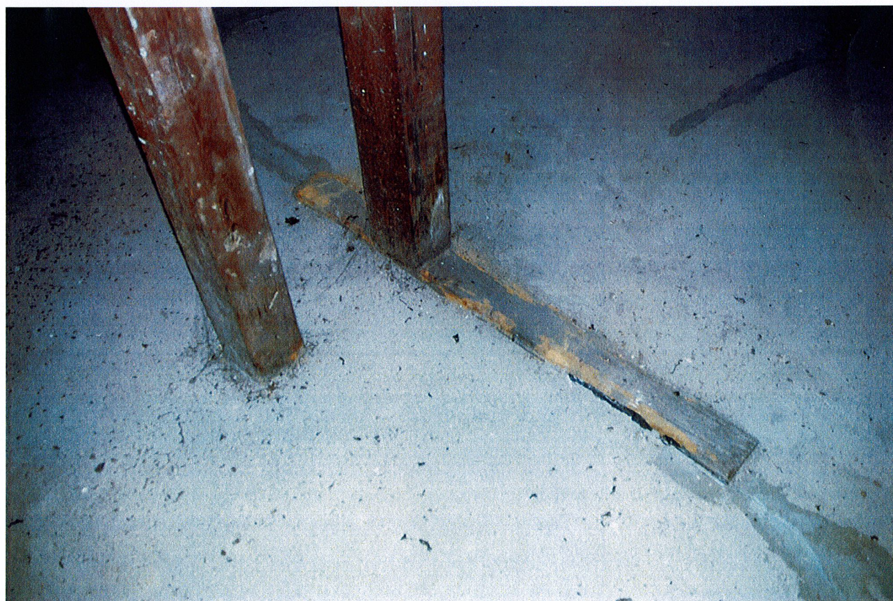
Fot. 8. Widok skorodowanej podwaliny