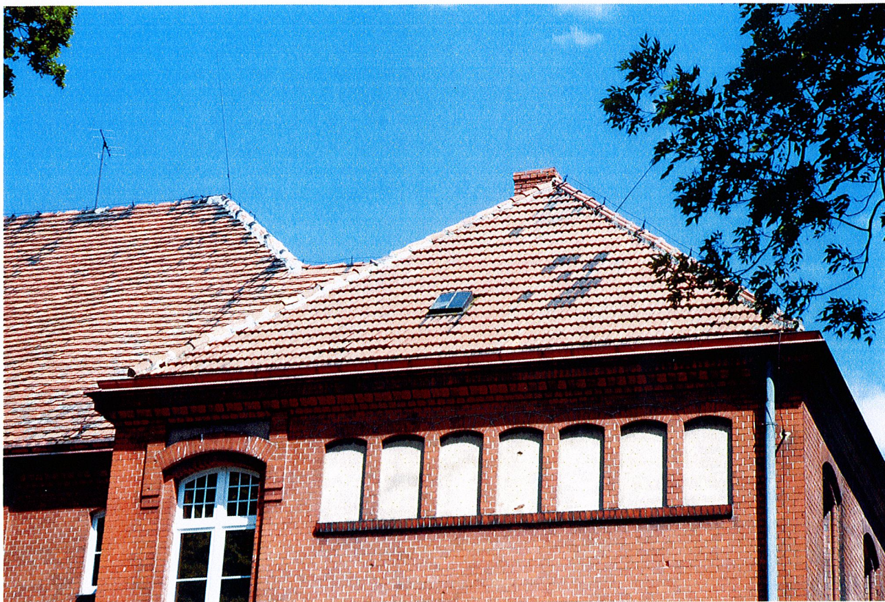
Fot. 3. Widok budynku we fragmencie od strony południowo-wschodniej