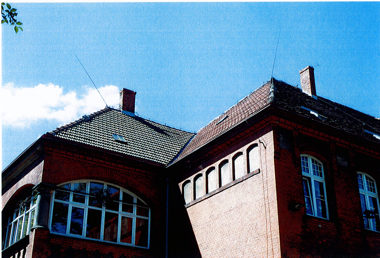
Fot. 4. Widok budynku we fragmencie od strony od strony wschodniej