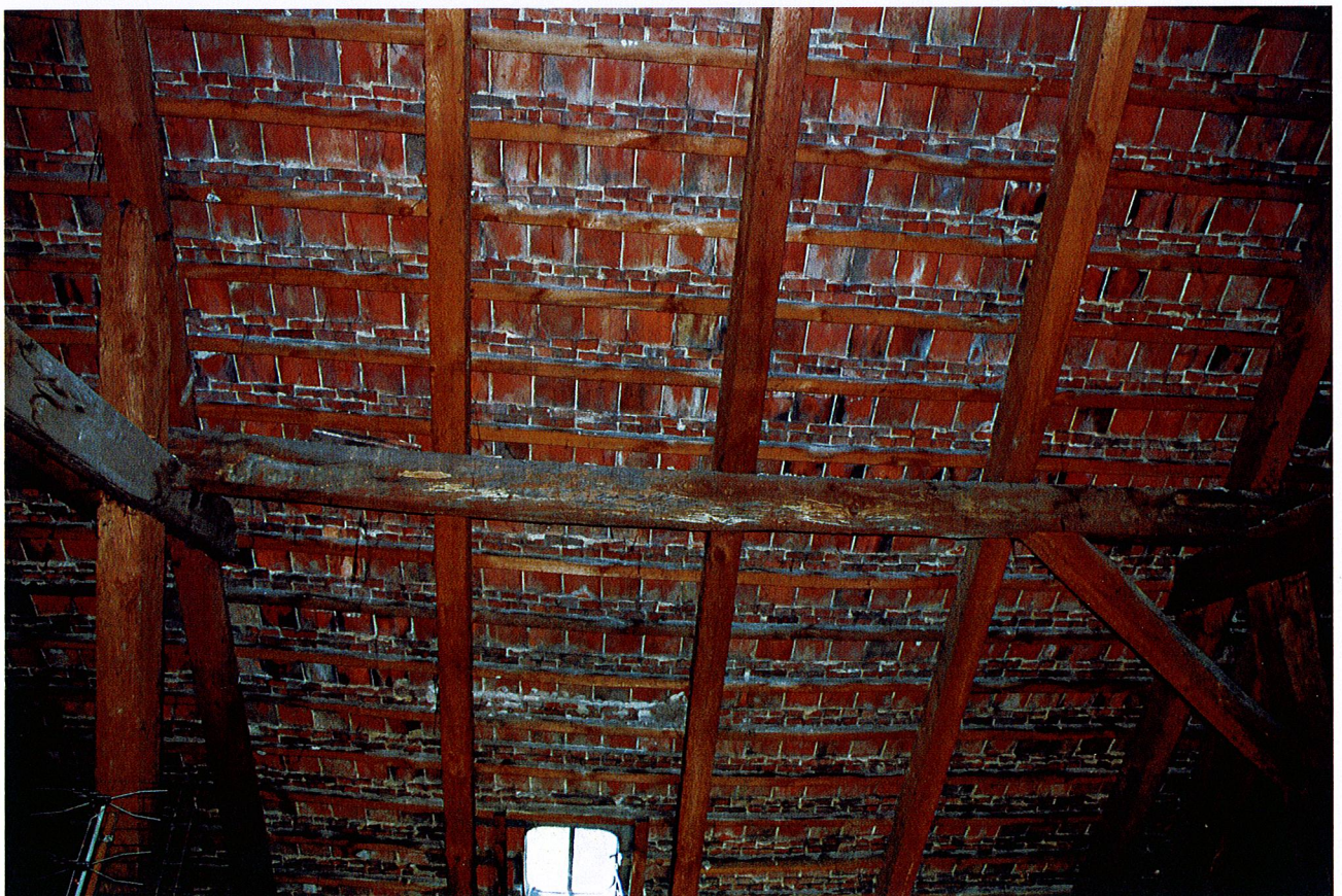
Fot. 10. Widok skorodowanej płatwi