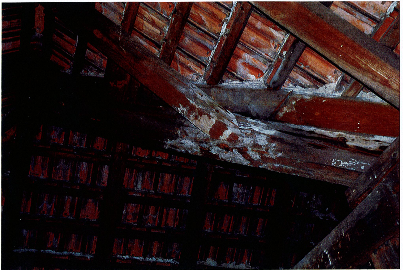
Fot. 9. Widok skorodowanej krokwi i krokwi koszowej