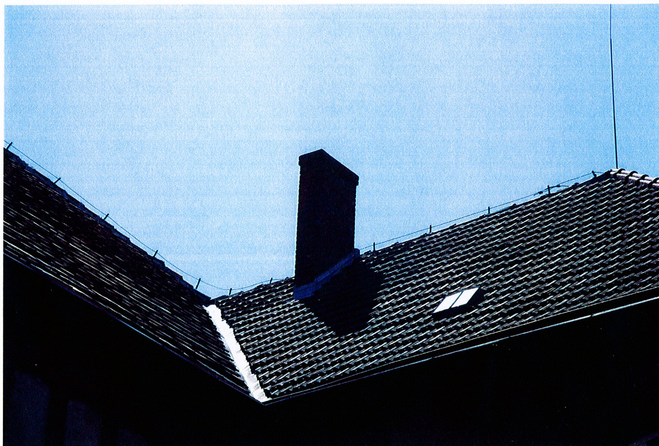
Fot. 7. Widok budynku we fragmencie od strony północno-zachodniej