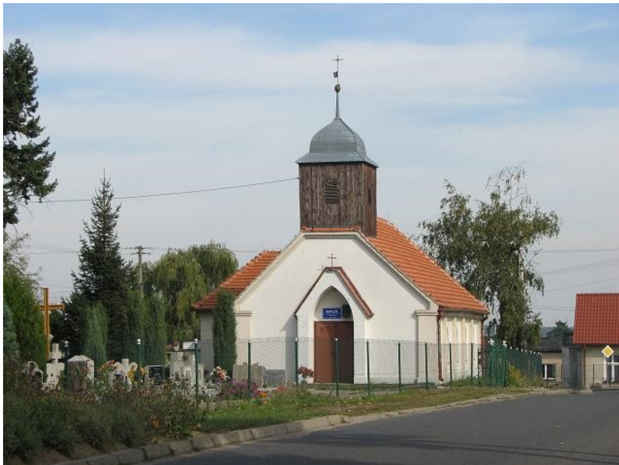
Kościół w Zaborowicach

Kościół w Zaborowicach p. w. Matki Boskiej Królowej Polski jest kościołem filialnym parafii w Czerninie. Powstał on jako kaplica cmentarna w 1766 r. i do dziś cmentarz się tam znajduje. Słownik geograficzny Królestwa Polskiego i innych krajów słowiańskich podaje, że wieś Saborwitz (Zaborowice) liczyła w 1842 r. 39 domów mieszkalnych i 245 mieszkańców, w tym 242 ewangelików i tylko 3 katolików. Po drugiej wojnie światowej kaplicę przejęli katolicy. Nazwy kaplica używano do czasu dobudowania zakrystii, a stało się to po 1965 r. Od lat 70-tych używa się tylko nazwy – kościół.