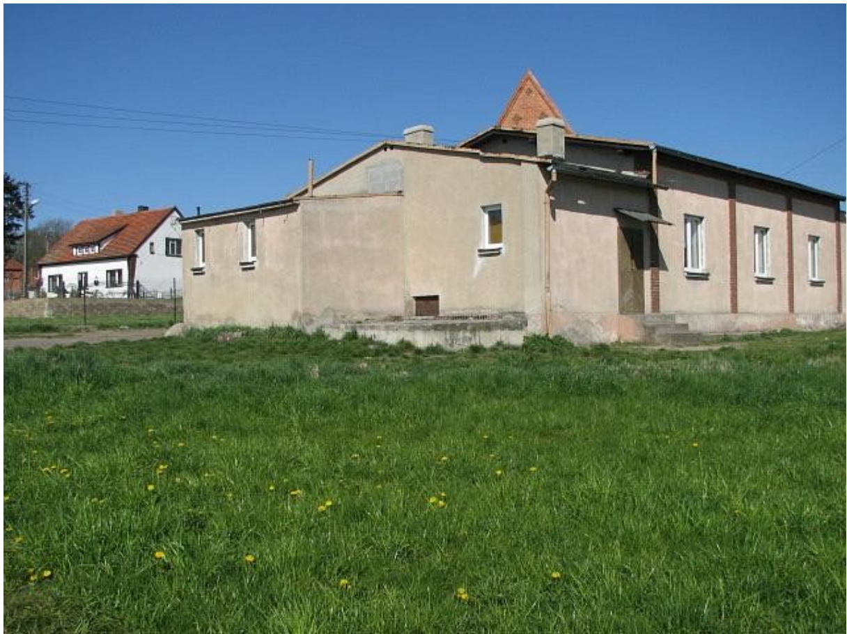
Zdjęcie powyżej przedstawia wejście do świetlicy wiejskiej w Zaborowicach przed planowanym remontem

Projekt 3: Zamontowanie oświetlenia przy świetlicy