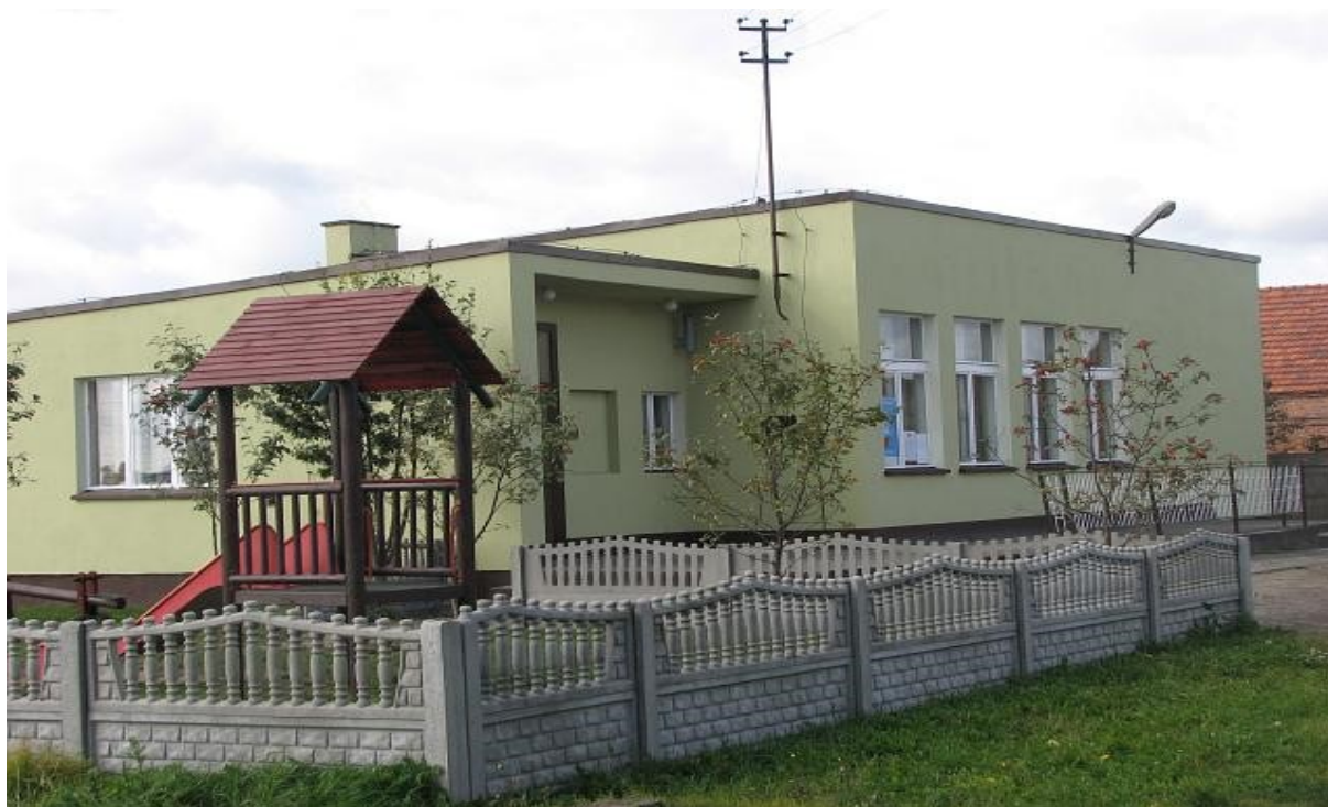
Zdjęcie powyżej przedstawia wejście do świetlicy wiejskiej w Wydartowie I przed planowanym remontem

Projekt 2: Zagospodarowanie terenu wokół świetlicy wiejskiej.