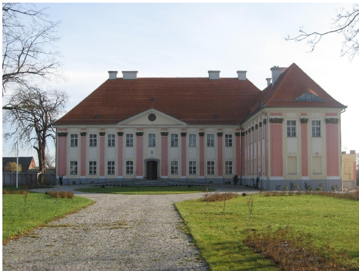
Pałac w Trzeboszu po renowacji

W parku nie brak starodrzewu. Pomnikami przyrody są tu 4 dęby szypułkowe.