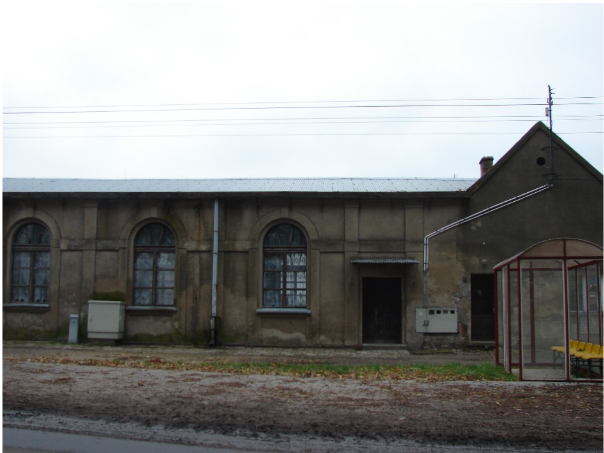
Zdjęcie powyżej przedstawia wejście do świetlicy wiejskiej w Trzeboszu przed planowanym remontem

Projekt 2: Zagospodarowanie terenu wokół świetlicy wiejskiej.