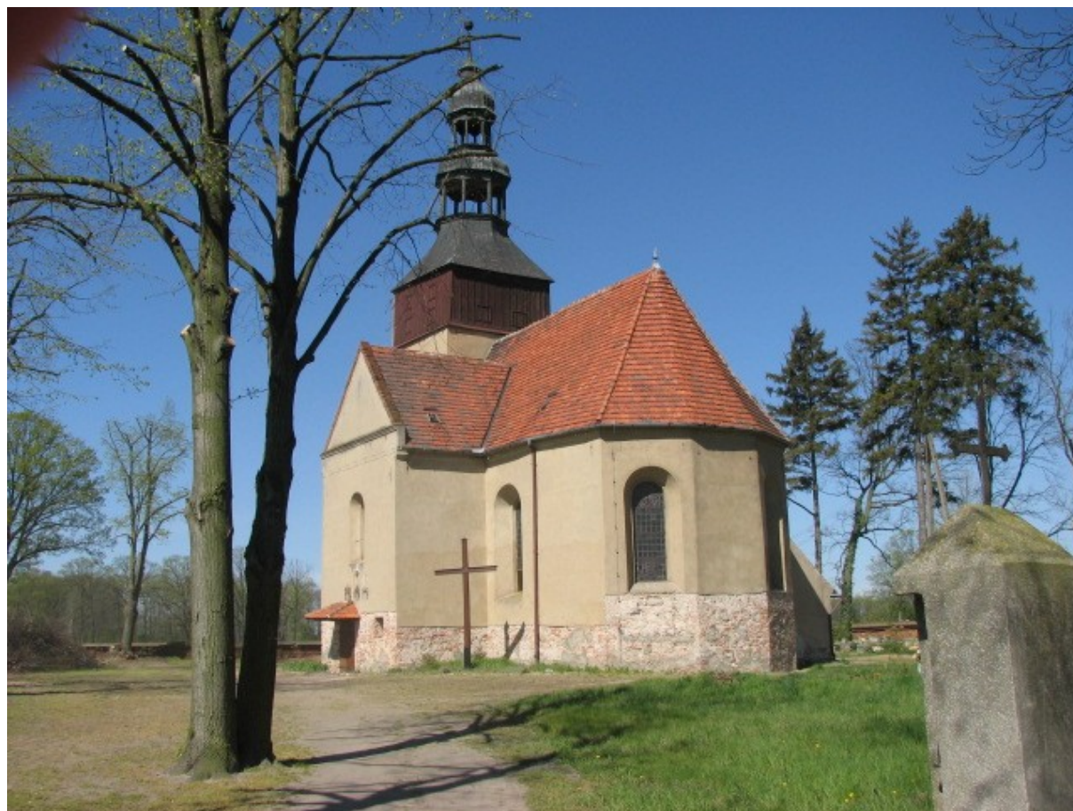
Kościół p.w. Matki Boskiej Częstochowskiej w Trzeboszu